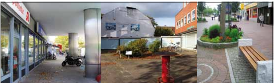
Bestandsaufnahme der Borsteler Chaussee und kleinräumige Maßnahmen zur Aufwertung des öffentlichen Raums am Beispiel der Lüneburger Straße, Hamburg

Die Idee ist, gemeinsam mit verschiedenen Akteuren im Stadtteil wie der Wirtschaftsförderung, der Otto Wulff Bauunternehmung, dem Kommunalverein und insbesondere den lokalen Gewerbetreibenden, zu diskutieren, wie das Potential der neu zuziehenden Bewohner/-innen für eine Aufwertung im Stadtteil und zur Stärkung des Einzelhandels, Gewerbes und der Dienstleistungen genutzt werden kann. Am 27. November 2017 findet das Auftakttreffen zum gemeinsamen Austausch über die Perspektiven und Chancen dieser Entwicklungen für das Zentrum von Groß Borstel statt. Ziel der Veranstaltung ist es zu erörtern, welche Möglichkeiten