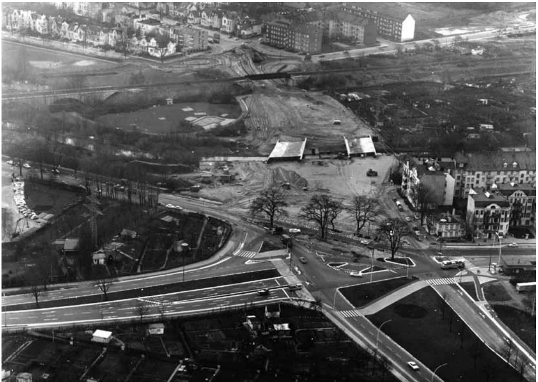
Luftaufnahme des Ausbaus Alsterkrugchausee/Deelböge. Die Blickrichtung geht nach Eppendorf, vorne rechts biegt die Borsteler Chaussee ab.