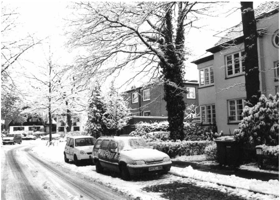
Der verschneite Moorweg mit Blick in Richtung Köppenstraße