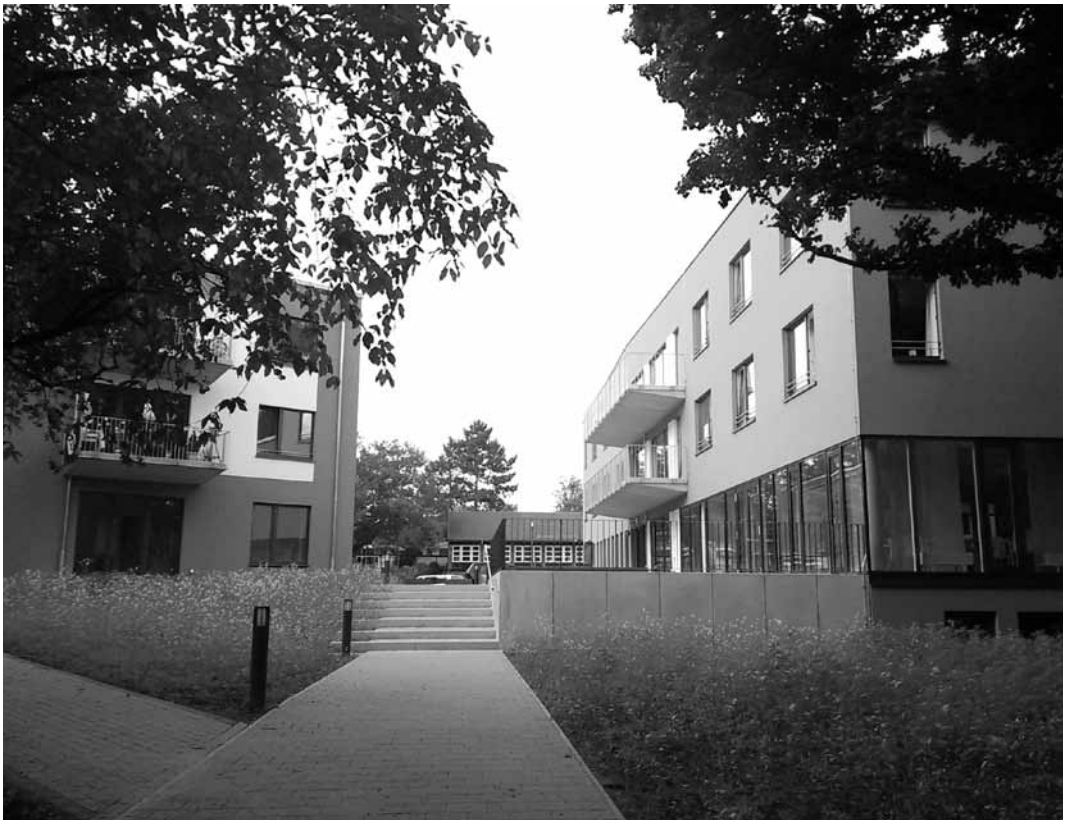
Häuser des BHH Sozialkontors im Klotzenmoor 62-64, siehe Artikel Seite 6