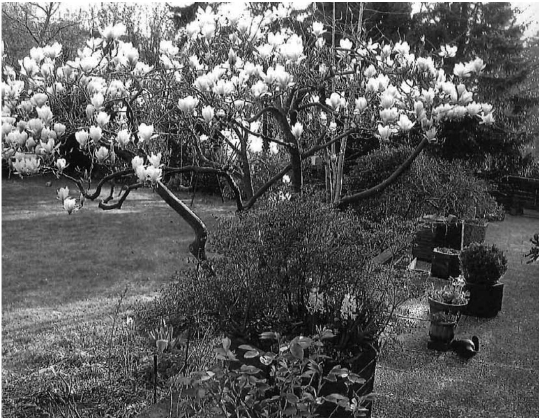
Frühlingserwachen im schönen Groß Borstel