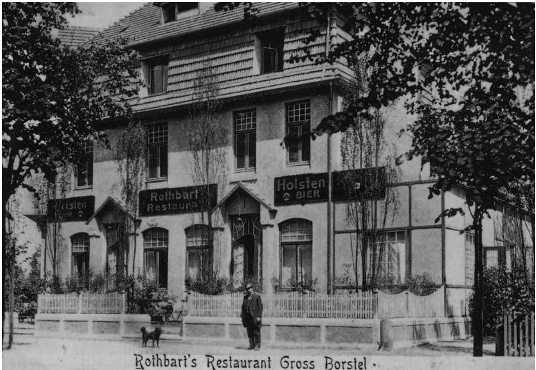
Rothbart's Restaurant Gross Borstel -

Bis 1919 war in diesem Haus "Rothbart's Restaurant", in dem u.a. die Vorstandssitzungen des Kommunal-Vereins stattfanden. Vorübergehend übernahm die "Produktion eGmbH" den rechten Teil des Hauses. Als 1981 die benachbarte Kohlenhandlung Paul Quast verschwand, zog die "Pro", später "Co op", in den Erweiterungsbau. Heute ist dort der "Edeka"-Laden.