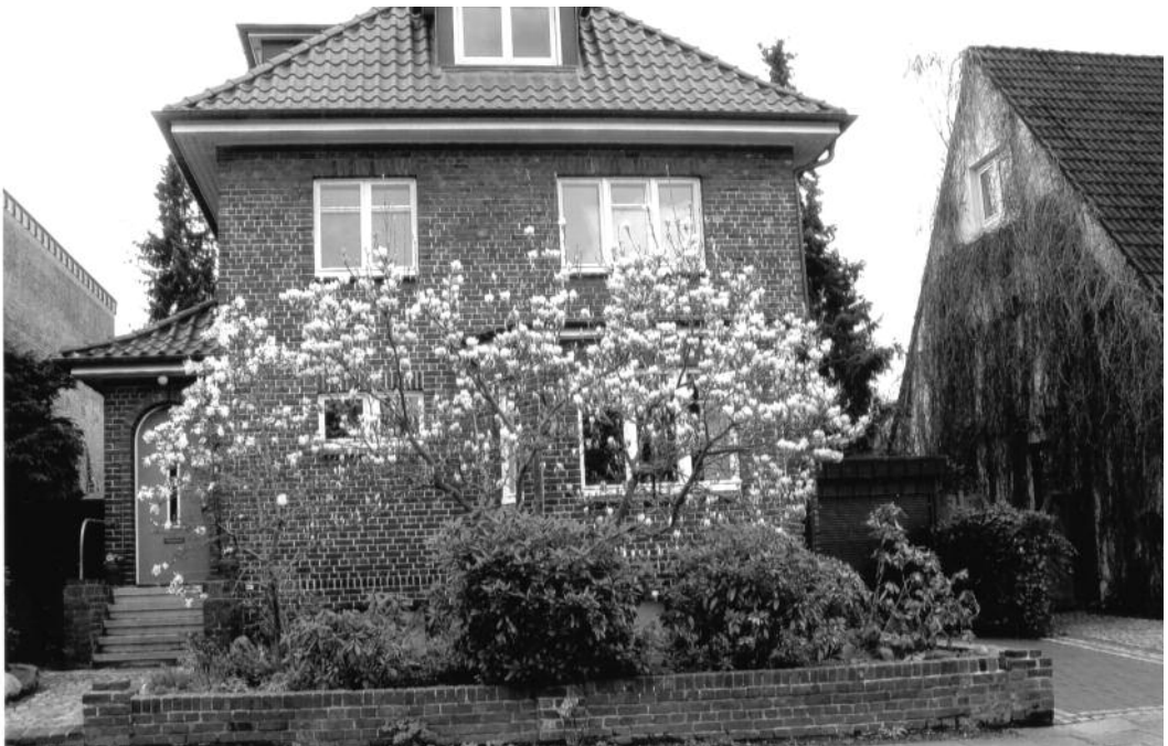
Nirnheimweg Nr. 8