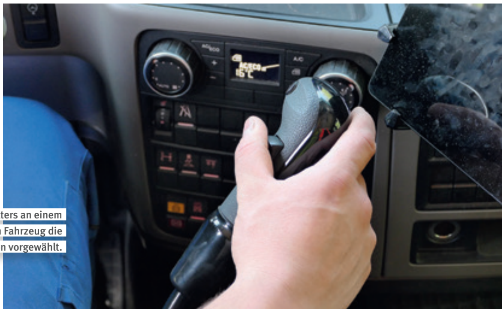
Durch Betätigen eines Wippschalters an einem Handgriff wird bei diesem Fahrzeug die Haltestellenbremsfunktion vorgewählt.

Nach Aussage des Kollegen fuhr D. immer mit Haltestellenbremse. Warum das Abfallsammelfahrzeug trotzdem wegrollte, lässt viel Spielraum für Spekulationen. Auch bei mehreren Simulationen ließ sich die Unfallursache nicht eindeutig klären. Ein technischer Defekt an der Bremsanlage lag offensichtlich nicht vor.