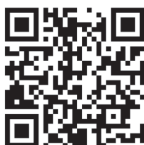
Umwelterziehung und Klimaschutz

Felix-Dahn-Straße 3, 20357 Hamburg Tel.: 040 428842-340 https://www.li.hamburg.de/umwelterziehung