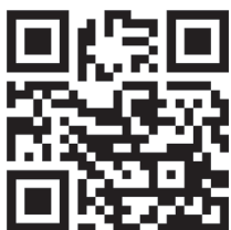
Beratungsstelle besondere Begabungen

Felix-Dahn-Str. 3, 20357 Hamburg Tel.: 040 428842-206 E-Mail: beratung-bbb@bsb.hamburg.de https://www.li.hamburg.de/bbb