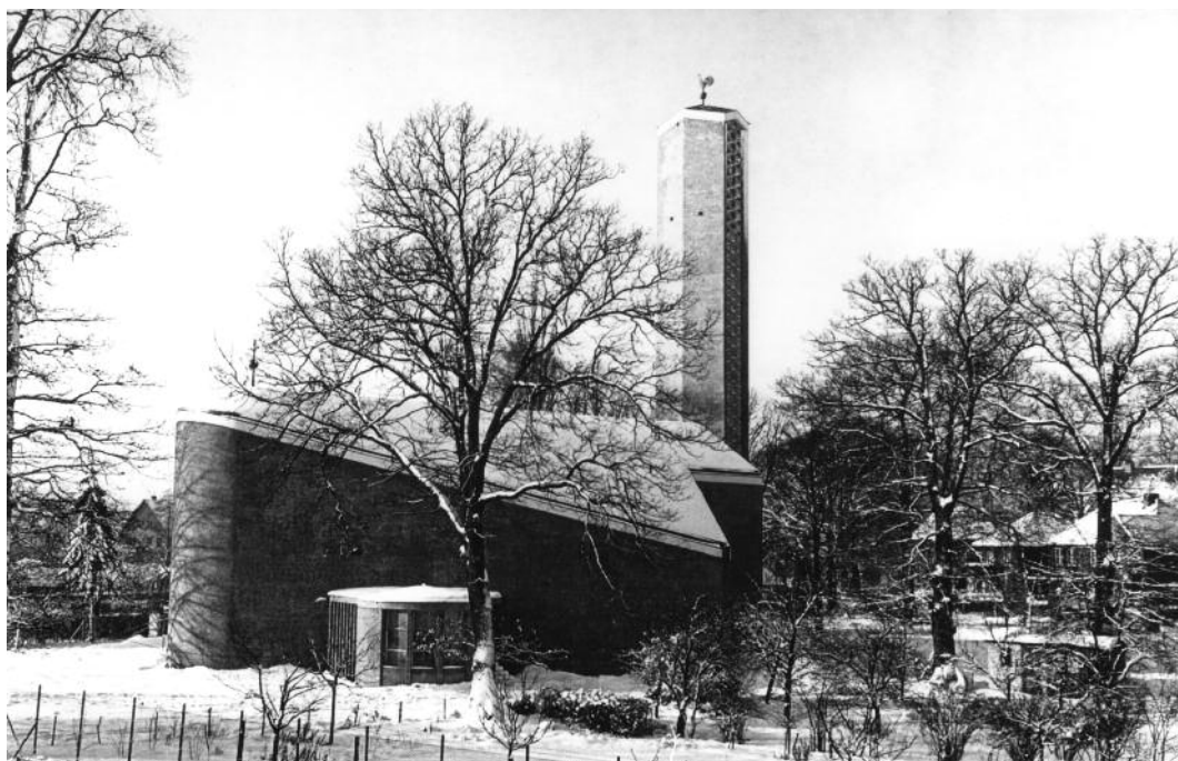
Kirche St. Peter, Schrödersweg/Ecke Borsteler Chaussee