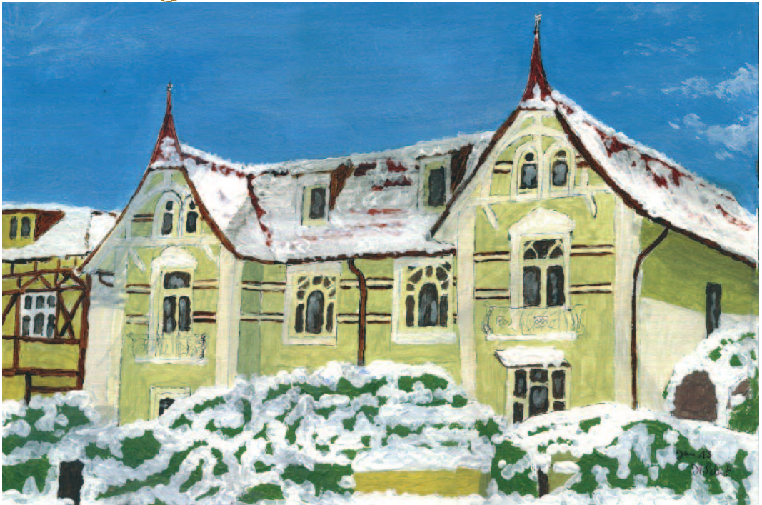
Warnckesweg 25 und 27, Bild in Acryl von Horst Scherf