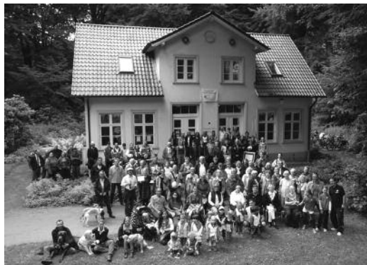
99 Stadtpark-Freunde 99 Jahre nach der Eröffnung des Stadtparks vor dem Sierichschen Forsthaus in der Hindenburgstraße.

Als Volkspark mitten in der Stadt wurde der Hamburger Stadtpark von Anfang an für die Nutzung über alle sozialen Schichten, Altersgruppen und Aktivitäten hinweg angelegt. Das Prinzip der Sichtachsen, die Eindrücke großer landschaftlicher Weite vermitteln, ebenso wie die harmonische Kombination der seinerzeit vorherrschenden Parkkonzepte „französischer