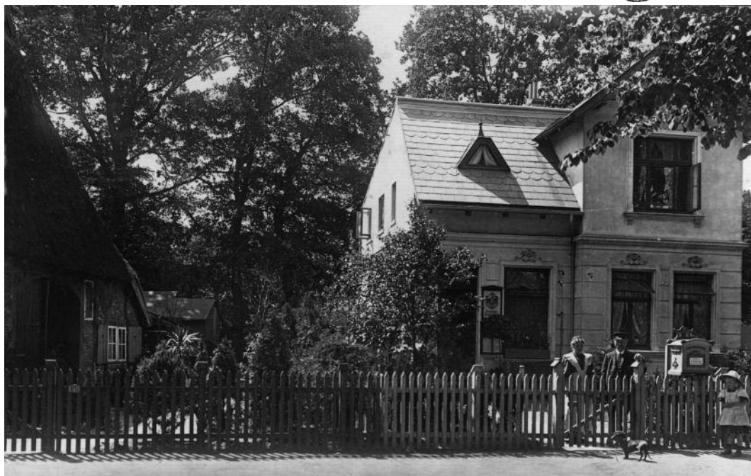
Borsteler Chaussee 161: die ehemalige Postagentur von 1905-1912 (siehe Artikel auf Seite 16)