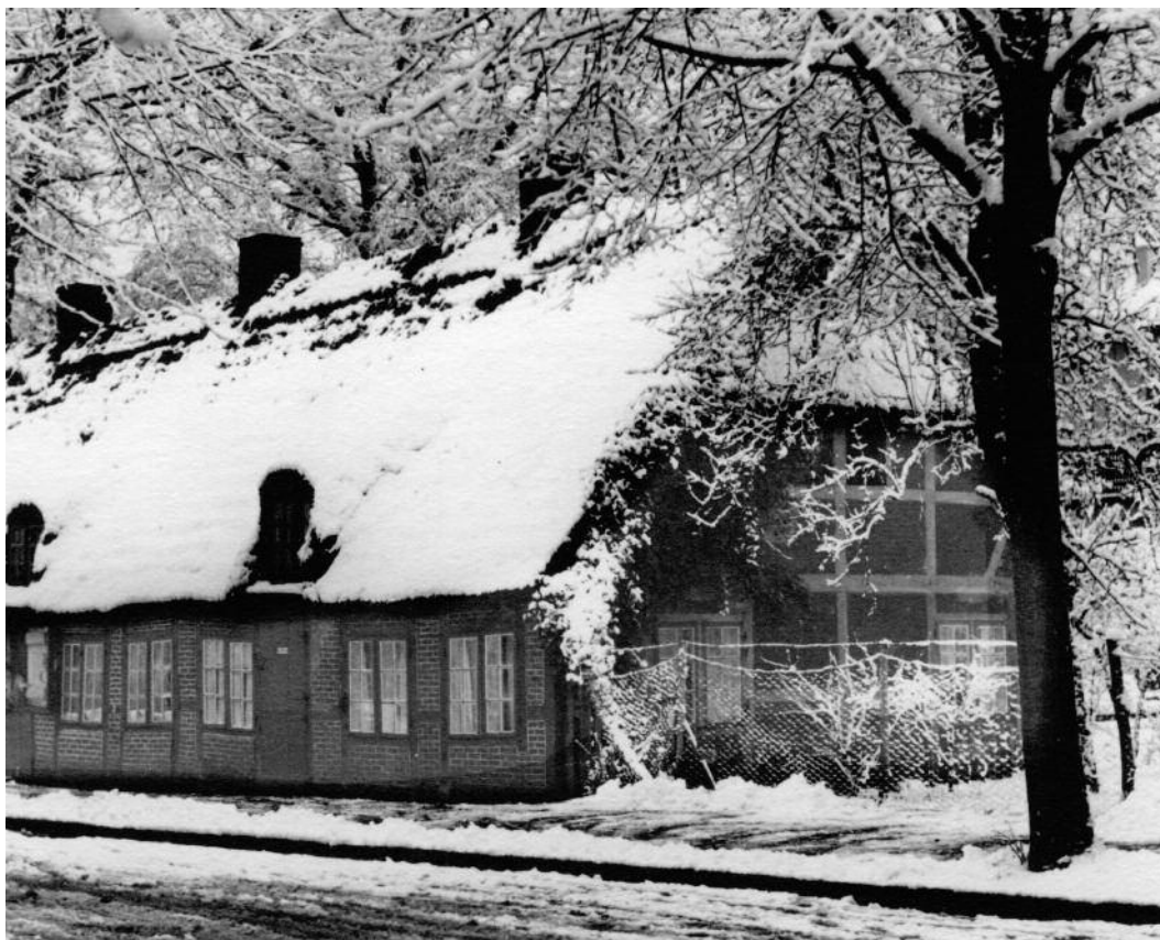
Alte Kate Schrödersweg/Ecke Borsteler Chaussee, gegenüber der Kirche.