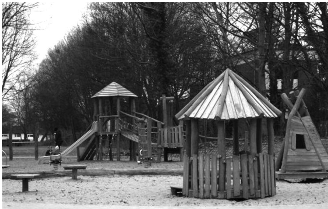
Spielplatz am Roggenbuck mit neuen Spielgeräten.