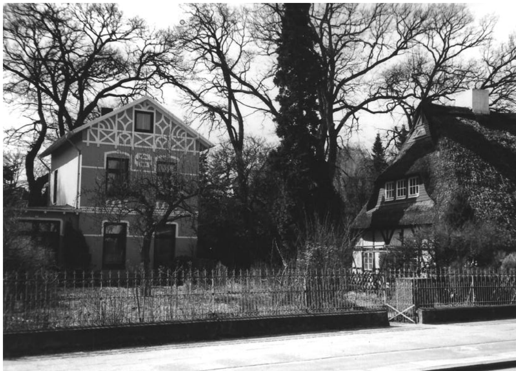
Borsteler Chaussee 161 "Villa Wilhelmine", rechts im Anschnitt das Georgi-Haus.