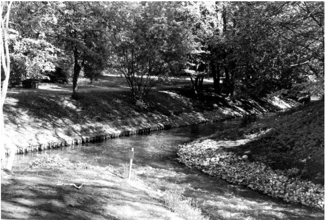
Einmündung der Kollau in die Tarpenbek.