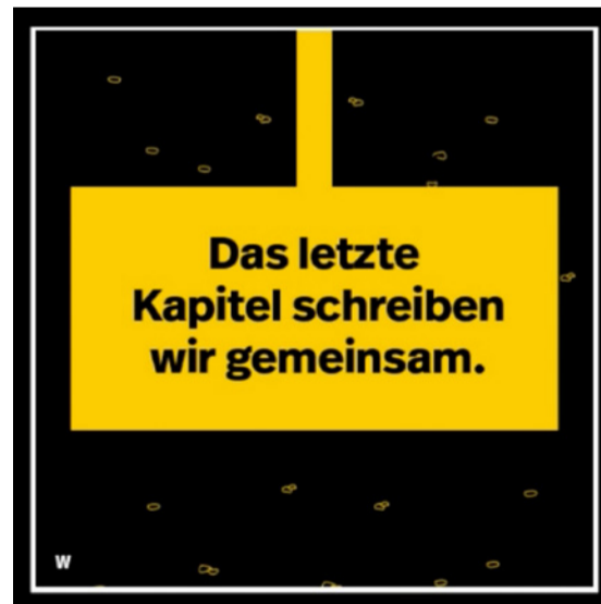
ORIGINAL: aus einem Werbefilm des BaSE