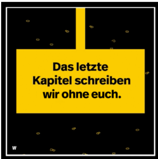
KORREKTUR: so läuft es wirklich

Baumwolltaschen – alles im klassischen Anti-Atom-Gelb gehalten. „Das letzte Kapitel schreiben wir gemeinsam!“, textet das für die Öffentlichkeitsbeteiligung bzw. PR zuständige Atommüll-Bundesamt (BaSE) im Rahmen einer Fünf-Millionen-Euro-Kampagne, die suggerieren soll: Mehr Beteiligung geht nicht. Und im Umkehrschluss: „Wer hier nicht mitmacht, ist nicht bereit, Verantwortung für das Allgemeinwohl zu übernehmen.“