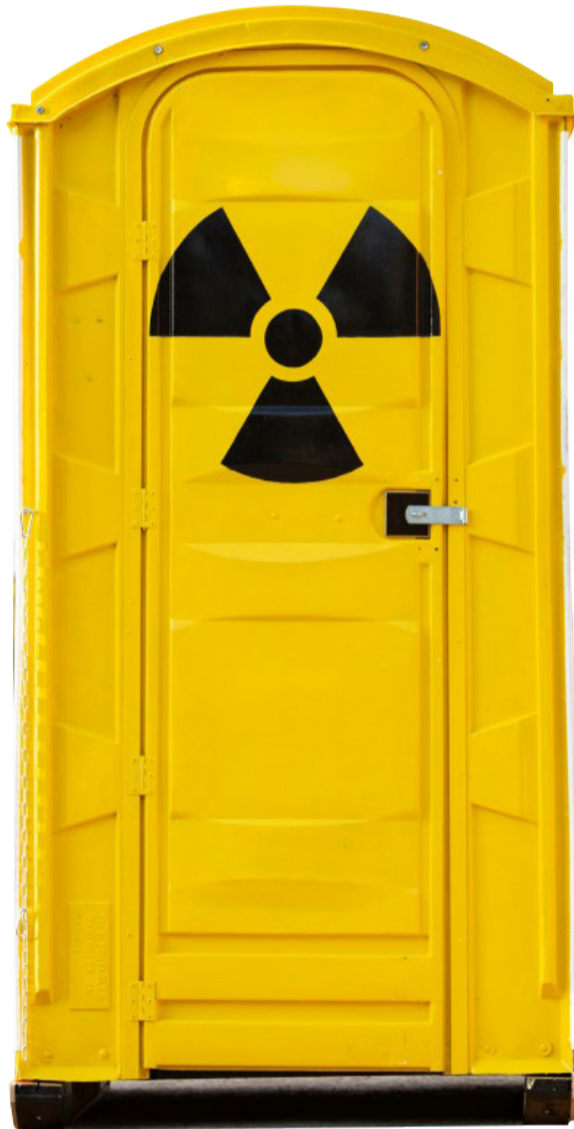
Atomklo der Nation? Das wünscht sich keine Region.