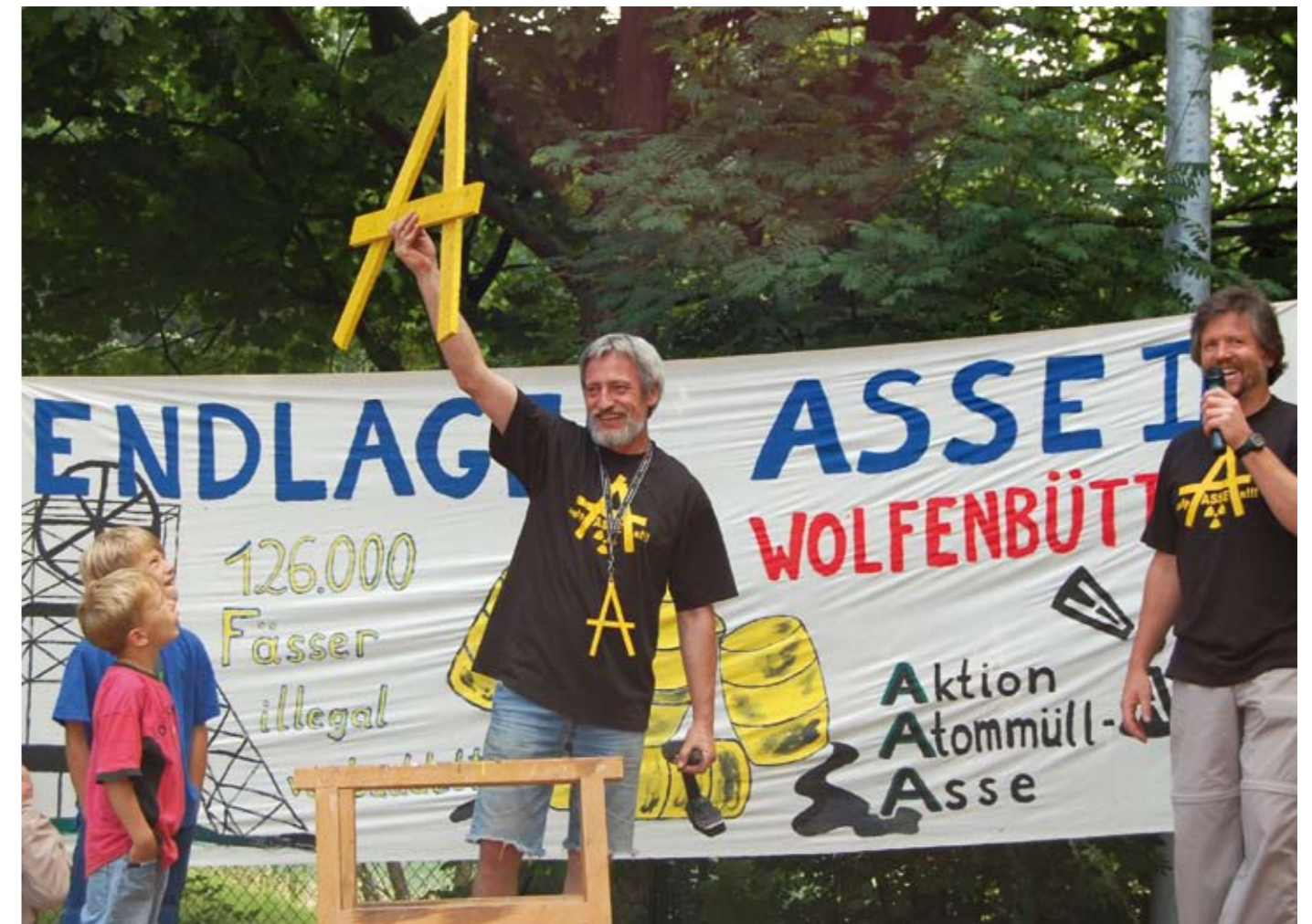
Was dem Wendland sein X, ist im Kreis Wolfenbüttel das A für aufPASSEn. Mehrere Tausend Stück in unterschiedlichen Größen haben in den letzten Wochen ihren Weg in Vorgärten und Fenster gefunden, das größte, unweit von ASSE II ist 10m groß.

Abgeordnete aller Landtagsfraktionen sprachen sich dagegen aus.