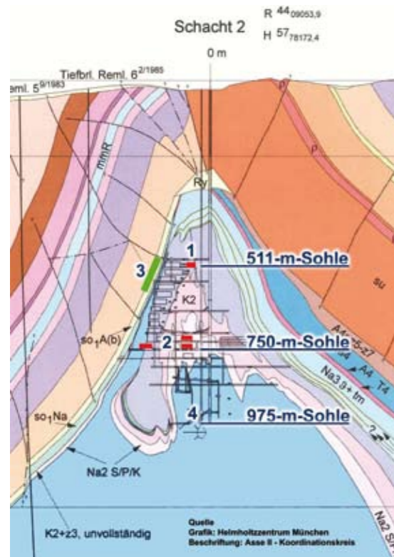
Schnitt durch die Schachtanlage Asse II: Mittelaktiver Müll auf 511 m (1), schwachaktiver auf 750 m (2). Wasserzutritte seit 1988 im Bereich der Südflanke (3). Der sog. Tiefenaufschluß bei 975 m (4) sollte ab September weiter geflutet werden. Das konnte jedoch einstweilen gestoppt werden

Gleichwohl hielt der Betreiber an seinem höchst umstrittenen Konzept fest, die Asse II zur Stilllegung zu fluten. Dabei sollten sehr spezifische Eigenschaften einer Salzlösung ausgenutzt werden. Bei der Stilllegung alter Salzbergwerke ist dieses Vorgehen durchaus üblich – aber bei Atommüll, der durch Flüssigkeit aufgelöst und mobilisiert werden kann? Gegen die geplante Flutung demonstrierten am 7. Juli rund 1.000 AnwohnerInnen,