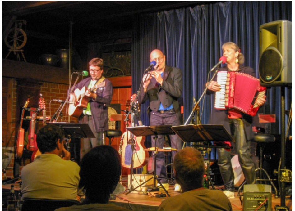
Deutschfolk-Konzert mit der Band Liederjan

Er habe, so Langeloh, nach dem für ihn fatalen Vorstandsbeschluss