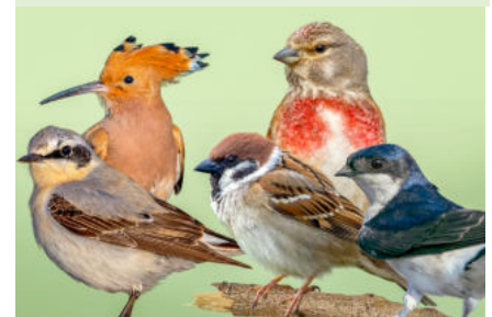
Von links - hinten: Wiedehopf, Bluthänfling, vorn: Steinschmätzer, Feldsperling, Mehlschwalbe

Der NABU ruft wieder zur Wahl des „Vogels des Jahres“ auf. Ins Rennen gehen: Bluthänfling, Feldsperling, Mehlschwalbe, Steinschmätzer und Wiedehopf. Jeder der fünf Vögel steht für ein Naturschutzthema, das Aufmerksamkeit braucht, so NABU-Bundesgeschäftsführer Leif Miller: Klimawandel, intakte Umwelt, fehlende Nistplätze, Insektensterben und Dezimierung von Lebensräumen. Abgestimmt werden kann bis zum Vormittag des 18. November . Noch am selben Tag wird der Sieger bekanntgegeben.