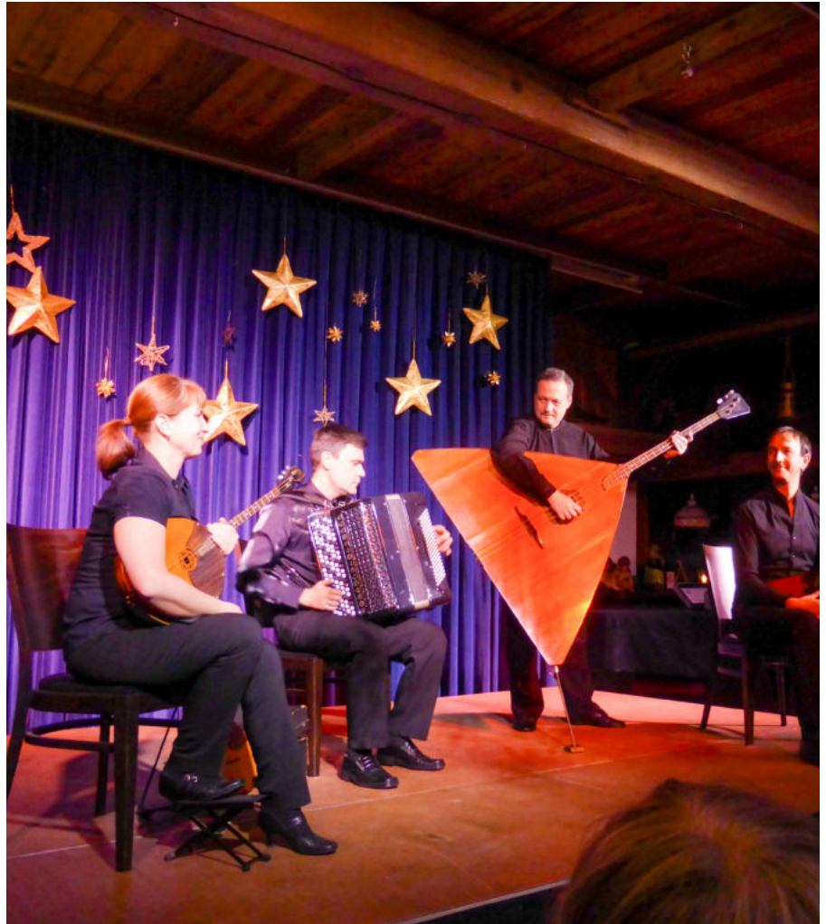
Vielfältige Kulturabende zeichnen den Heidbarghof aus: Hier die Gruppe Exrompt zu Gast mit russischer Musik

Aber es geht wohl gar nicht in erster Linie ums Geld. Eher scheint es, dass der Mehrheit des Vorstands „die ganze Richtung nicht passt“. Erich Becker zufolge werde der Wille der Stifterin nicht angemessen beachtet,