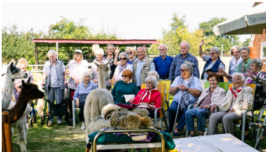
Die Osdorfer SeniorInnen mit bester Laune bei den Alpakas