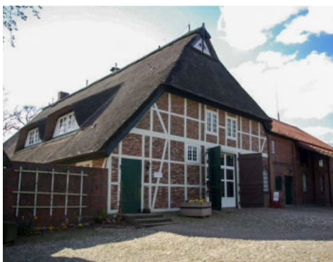
Haus des Anstoßes: Über die Kultur im Heidbarghof wird gestritten.