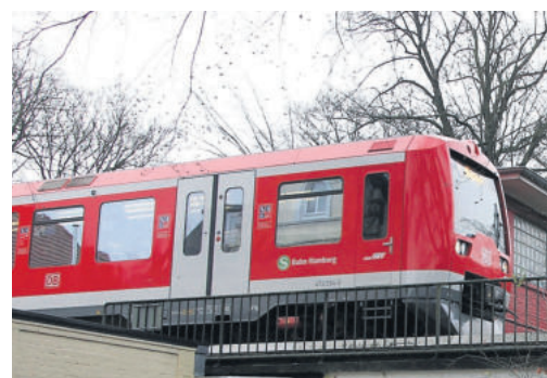
Schnellbahn weiter ohne Anschluss im Osdorfer Born

Das Flaßbargmoor, der letzte Rest der alten Osdorfer/Luruper Moore, enthält zahlreiche Biotope. Eine