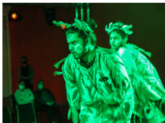
Die Dreamcatchers und Osdorfer Jugendliche bei den Proben und der Aufführung von „Magic Mirror“ · Fotos: Ekkehard Schultze und Privat