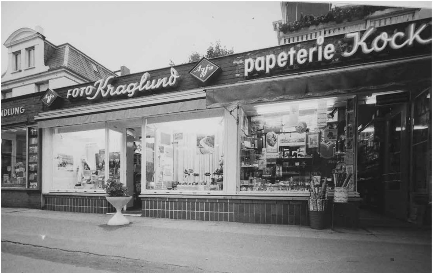
Waitzstraße 22, 1973, Papeterie Kock, Foto Kraglund Buchhandl. Harder (C) Archiv Flottbek-Othmarschen: Heute (Buchhandlung Harder, Textilreinigung Latifi, Großmann & Berger)