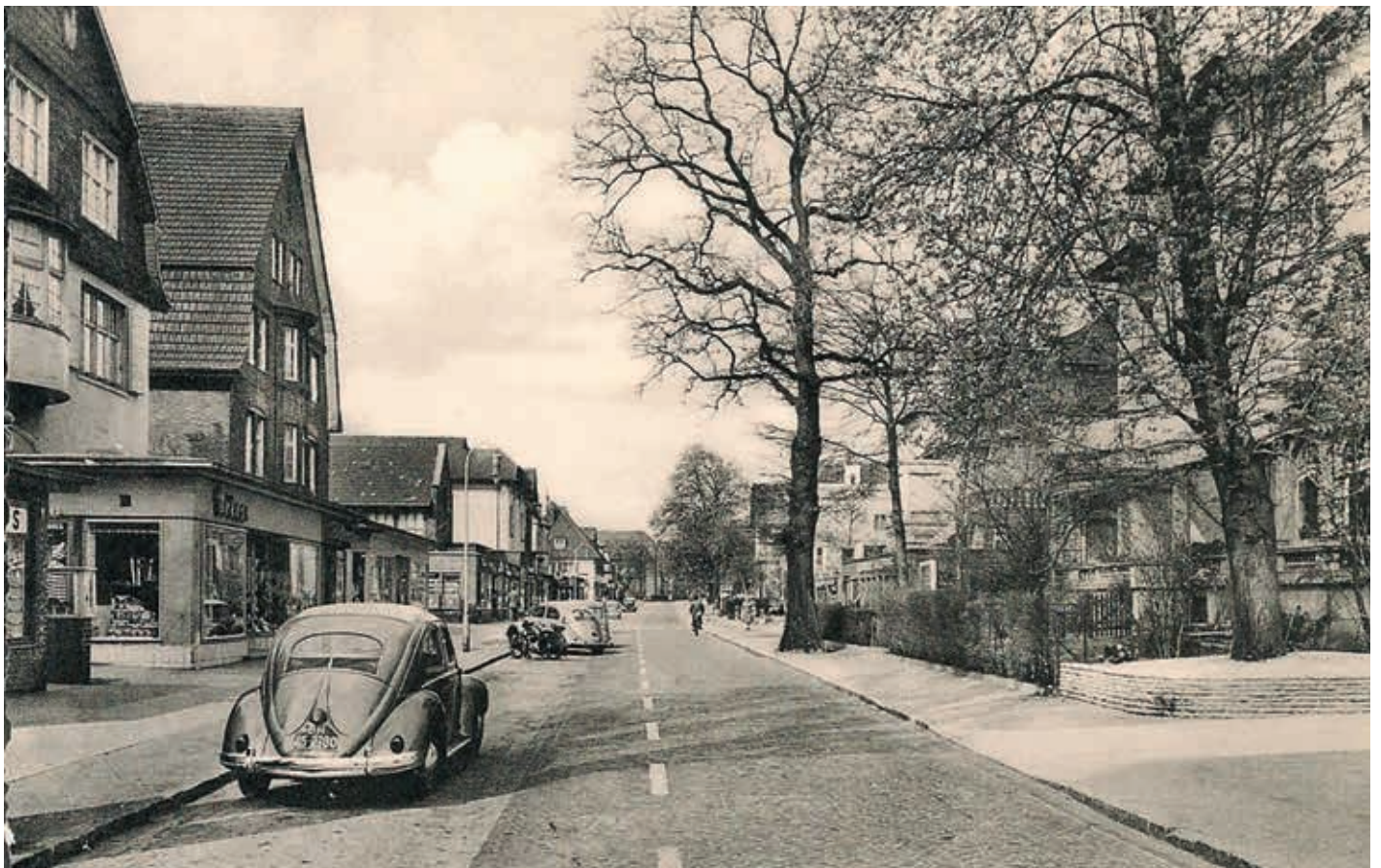
Waitzstraße vorderer Bereich 1952