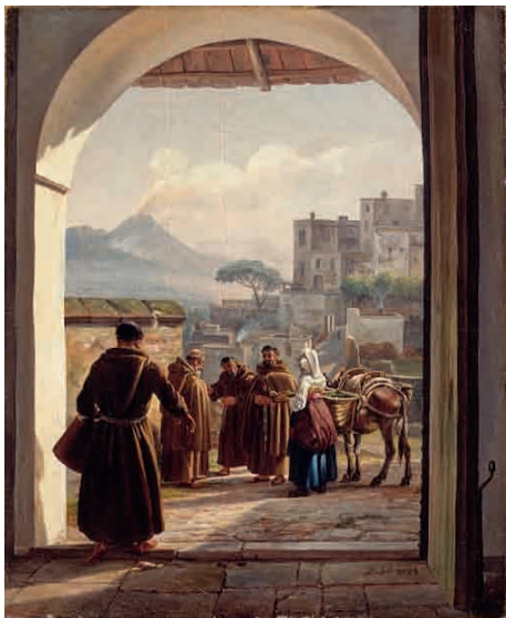
Fig. 1: Johan Christian Dahl, Franziskaner in Neapel , 1823, Öl auf Leinwand, 39,5 x 32,0 cm. Privatsammlung, Oslo.

Nach seiner Rückkehr malte Dahl 1823 in Dresden eine etwas größere Variante nach der vorliegenden Skizze mit vier Franziskaner-Mönchen und einer Frau mit Packesel als Staffage. Das Bild befindet sich in einer Privatsammlung in Oslo [Fig. 1] 4 .