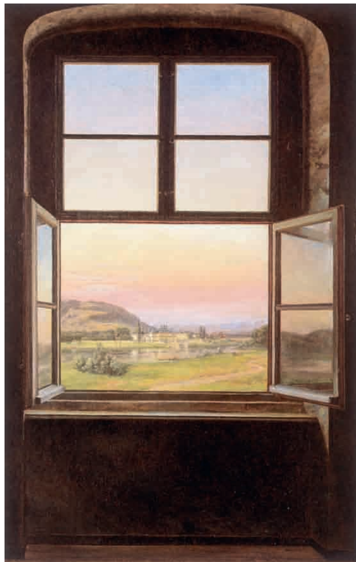
Fig. 1: Johan Christian Dahl, Blick aus einem Fenster auf Schloss Pillnitz , 1823. Öl auf Leinwand, 70 x 45,5 cm. Museum Folkwang, Essen.