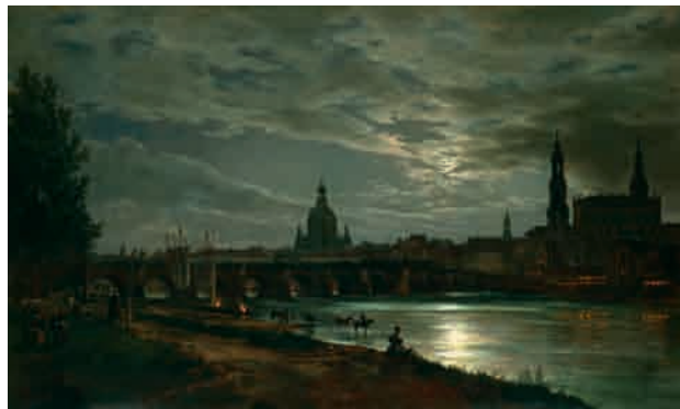
Fig. 2: Johan Christian Dahl, Dresden im Mondlicht , 1839.