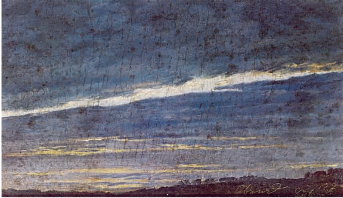
Fig. 2: Caspar David Friedrich, Abend , 1824. Öl auf Karton, 12,5 x 21,2 cm. Österreichische Galerie im Belvedere, Wien.

zu schweren psychischen Belastungen führte, während Dahl durch die Leichtigkeit des Produzierens, seine Fähigkeit, den Zeitgeschmack zu treffen, und durch sein Geschick, sich in der Gesellschaft zu bewegen, ein beachtliches Vermögen sammeln konnte. Er unterstützte Friedrich, wo es möglich war, bezeugte ihm auch seine Verbundenheit, indem er ihn 1827 zum Paten seines Sohnes Siegwald wählte, aber dennoch entstand bei dem an den Rand Gedrängten eine Bitterkeit, die sich auch gegen den Freund richtete. Zu schmerzlich war der Kontrast von Erfolg und unverdienter Zurücksetzung.