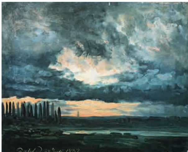
Fig. 1: Johan Christian Dahl, Wolkenstudie über der Elbe mit Pappeln , 1832. Öl auf Papier, 21,5 x 26,0 cm. Nationalgalerie, Oslo.

Von seinem Atelierfenster im fünften Stock des Hauses An der Elbe Nr. 33 hatte Dahl einen freien Blick über das Elbtal, was seine Vorliebe für Himmelstudien beflügelt haben mag. Der Übergang zwischen den Natur- und Wolkenstudien ist dabei oftmals fließend. Meistens bleibt, schon durch die flache oder sanft