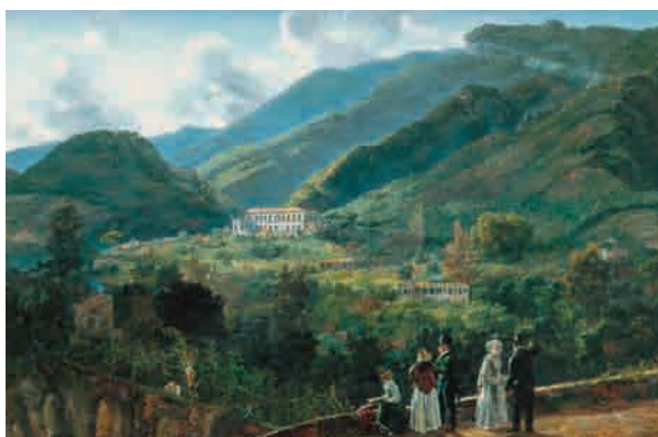
Fig. 1: Johan Christian Dahl, Quisisana von einer Terrasse aus gesehen mit fünf Mitgliedern des Hofstaates , 1820/21.

Dahls künstlerisches Schaffen war schon früh vom dänischen Königshaus gefördert worden. Frederik VI kaufte z. B. die Nordische Landschaft mit Wasserfall von 1817 für die königlichen Gemäldesammlungen an.