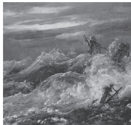
Fig. 2: Johan Christian Dahl, Schiffbruch (Brecher mit Schiffsmast und Takelage), 1852. Öl auf Holz, 12,5 x 13,5 cm. Privatsammlung, Norwegen.