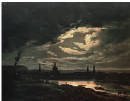
Fig. 3: Johan Christian Dahl, Dresden im Mondlicht , 1841. Öl auf Leinwand, 27 x 35 cm. Hannover, Niedersächsische Landesgalerie.