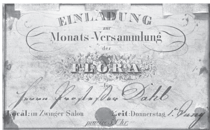
Fig. 1: verso: Einladung zur Monats-Versammlung der Flora.

Dahl hat während seines gesamten Lebens Mondscheinlandschaften gemalt. Diese Bilder fanden große Resonanz bei den jährlichen Akademie-Ausstellungen und waren bei seinen internationalen Kunden hoch begehrt. Die ersten Nachtszenen malte der Künstler 1814 als Student an der Kopenhagener Akademie. Diese Bilder sind noch geprägt von niederländischen Vorbildern des 17. Jahrhunderts, wie Aert van der Neer oder Jacob van Ruisdael. In einem Brief vom 15. Oktober 1814 schrieb Dahl über die Nächtliche Ansicht des Esrom-Sees : „... besonders gut gelungen ist mir an diesem Bild das weiche Mondlicht über der Landschaft, eine Stille über der ganzen Region, die ihr Feierlichkeit und Schönheit verleiht, das Mondlicht auf den Wolken, die Spiegelungen im Wasser, kurz jene Düsterei des Lichts die eine nächtliche Stimmung schafft“ 1 . Diese Beschreibung trifft auch auf unser Bild zu. Dahl war 1818 nach Dresden gekommen und eng mit Caspar David Friedrich befreundet. Beide Künstler verband ein aus dem Geist der Romantik erwachsenes Interesse an Mondscheinlandschaften. Während für Friedrich der nächtliche Himmel als Symbol des Ewigen und Göttlichen immer auch einen transzendenten Aspekt besitzt, ist er für Dahl ein Naturphänomen, dessen optisch-ästhetischer Reiz ihn als Maler fesselte.