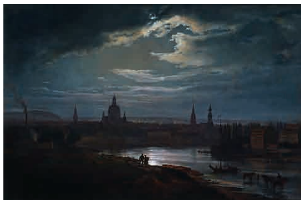
Fig. 4: Johan Christian Dahl, Dresden im Mondlicht 1843.