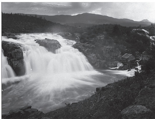
Fig. 1: Ryfoss in Valdres, zwischen den Gemeinden Vang und Vestre Slidre, Norwegen. Photographie von Carl Curman, um 1890.

Dahl kehrte noch vier weitere Male (1834, 1839, 1844 und 1850) nach Norwegen zurück. Die letzte Reise unternahm er zusammen mit seinem Sohn Siegwald. Von Oslo aus führte sie der Weg durch das Valdres, eine Landschaft im zentralen Südnorwegen, die Dahl bereits 1844 besucht hatte. Zwischen dem 15. und 24. August 1850 wanderten die beiden Männer über Tonvolden, Strand, Bruflat und die Hjelle Farm in Vestre Slidre nach Vang 2 . Auf diesem Weg liegt auch der Ryfoss, ein Wasserfall bei Vosswang (auf dem Klebeetikett auf der Rückseite unseres Bildes ist von Fossum die Rede), an dessen Ufer sich im 19. Jahrhundert eine Sägemühle befand. Eine um 1890 entstandene Photographie zeigt den Wasserfall und die Holzbauten der Mühle, ähnlich wie sie auch auf unserer Ölskizze zu sehen sind [Fig. 1]. Dahl hat diesen spektakulären Natureindruck zwei Jahre später in Dresden zu dem vor-