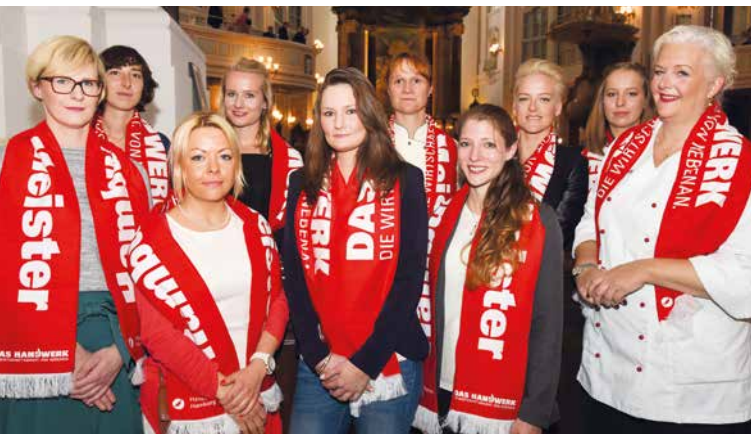
Mit „INa“ haben sie es geschafft: frisch gebackene Meisterinnen bei der Meisterfeier.