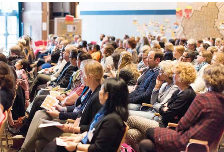
Schulmentoren-Jahresempfang im Bürgerhaus Wilhelmsburg.

Die teilnehmenden Schulen liegen in den vom Rahmenprogramm Integrierte Stadtteilentwicklung (RISE) unterstützten Quartieren Altona-Altstadt, Billstedt/Horn, Dulsberg, Eidelstedt-Mitte, Hamburger Innenstadt/Eißendorf-Ost, Hohenhorst, Neuallermöhe, Neugraben, Neuwiedenthal, Osdorfer Born, Steilshoop, Veddel und Wilhelmsburg. Ziel ist es, Schulen in schwieriger Lage nachhaltig zu stärken, um den Lernerfolg der Kinder und Jugendlichen zu verbessern. Schülerinnen und Schüler sollen eine Vorbildfunktion für Gleichaltrige übernehmen. Eltern erhalten im komplexen Schulsystem Unterstützung, damit sie als aktive Partner die Bildungsbiografien ihrer Kinder mitgestalten können. Ehrenamtliche verfolgen das Ziel, Lernbedingungen von Schülerinnen und Schülern zu verbessern und ihre Bildungspotenziale auszuschöpfen. Zudem wird in jeder Schule ein Netzwerk außerschulischer Ehrenamtlicher zur Erhöhung der Bildungsbeteiligung aufgebaut.