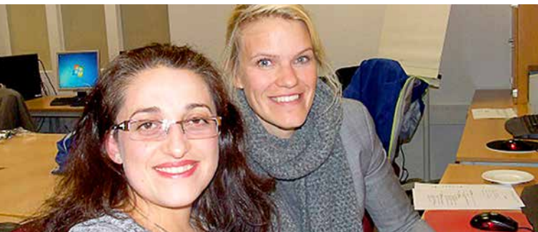
Bewerbst raining: Persönliche Begegnungen bauen Brücken von der Theorie in die Praxis.

Ausbildung und Arbeit unterstützen. Dieses Angebot richtet sich zum einen an bereits länger in Hamburg ansässige Zuwanderinnen und Zuwanderer aus den Hauptfluchtregionen und zum anderen an Menschen, die ein vertieftes Interesse an diesen Regionen mitbringen. Alle Angebote des Projekts sind interkulturell an den Bedürfnissen der Teilnehmenden ausgerichtet und stehen ihnen kostenfrei zur Verfügung. Der Projektverbund ist innerhalb eines breit angelegten Netzwerkes im Bereich Migration und Flucht tätig, unter anderem besteht eine Kooperation mit dem von Bund und Land geförderten Projektverbund „FLUCHTort Hamburg 5.0“ und dem „Hamburger Bündnis FLUCHT MIGRATION Bildung Arbeit“ deren Koordination ebenfalls bei der passage gGmbH angesiedelt ist.