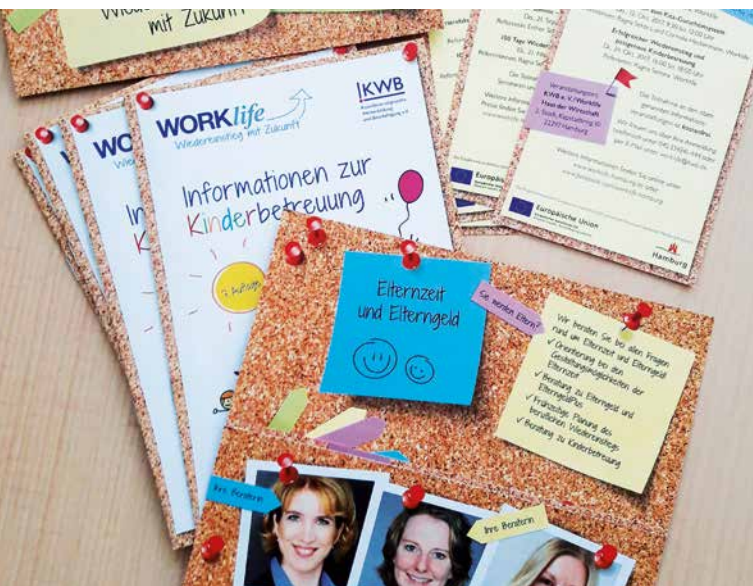
Worklife-Informationen zur Kinderbetreuung.

„Worklife“ informiert die Teilnehmenden zu Themen wie beruflichem Wiedereinstieg, Stellensuche, Bewerbung, Elternzeit und Kinderbetreuung. Flankiert durch berufsbezogene Qualifizierungsangebote, erhalten die Teilnehmenden umfassende Unterstützung auf ihrem persönlichen Weg zurück in die Berufstätigkeit. Neben einer an den Potenzialen der Teilnehmenden ausgerichteten Standortbestimmung finden eine Analyse der Arbeitsmarktanforderungen und ein zielgerichtetes Selbstmarketing statt. Der berufliche Wiedereinstieg nach einer Familienzeit bringt meist Veränderungen sowohl für die betreffende Person als auch für das familiäre Umfeld mit sich – „Worklife“ bezieht auch diesen Aspekt mit ein. Minijobberinnen und -jobber mit dem Wunsch, eine sozialversicherungspflichtige Beschäftigung auszuüben, erhalten Informationen zu ihren Rechten und Pflichten als geringfügig Beschäftigte sowie Argumentationshilfen für eine sozialversicherungspflichtige Beschäftigung.