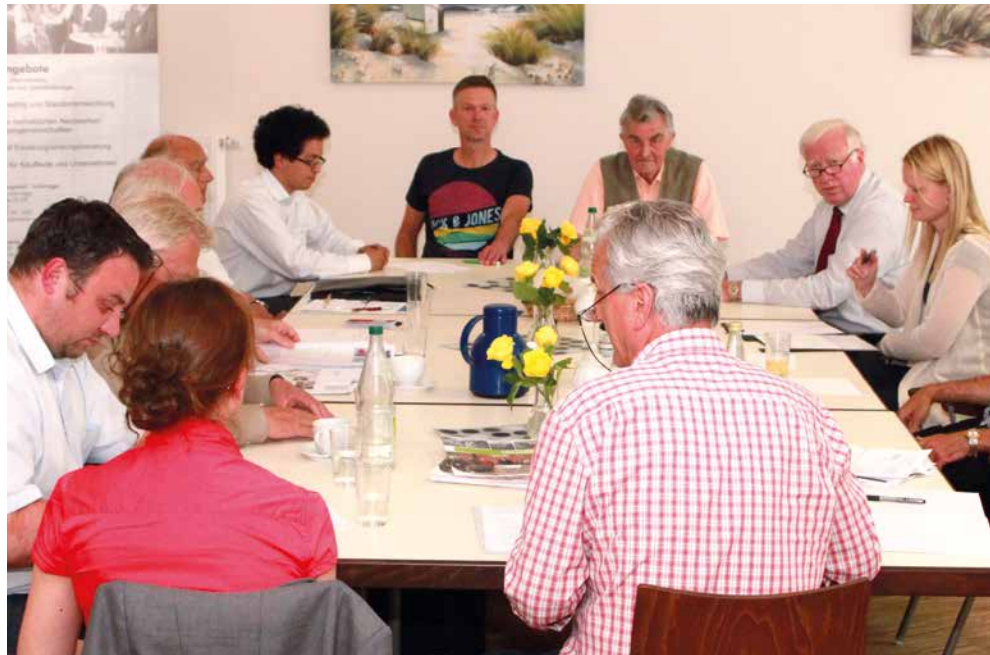
Foto: Regionale Qualifizierung für Beschäftigte und InhaberInnen von KMU 2017–2020

Projektleitung: Jürgen Roloff Beschäftigung und Bildung e. V. Repsoldstraße 27 20097 Hamburg www.lokale-wirtschaft.de roloff@lokale-wirtschaft.de