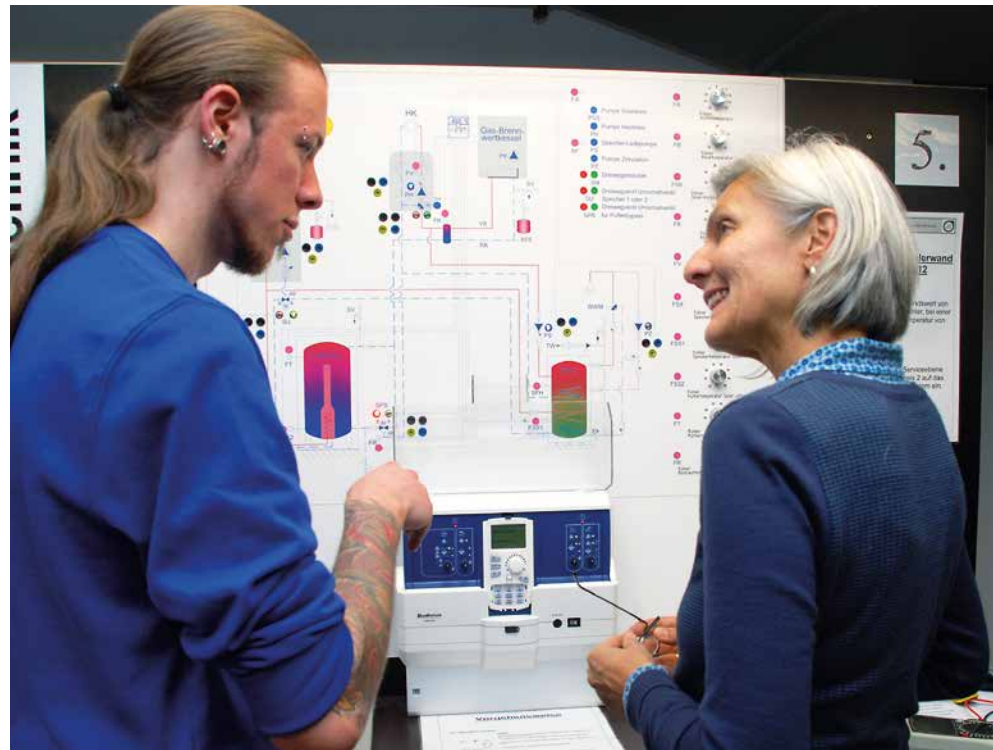
Im Praxiskurs der SHK-Innung können Lehrkräfte neue Berufe entdecken.