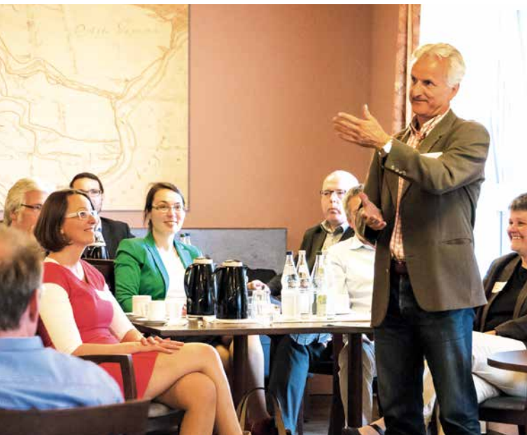
Foto: Regionale Qualifizierung für Beschäftigte und InhaberInnen von KMU 2017–2020

Beschäftigte sowie Inhabende von kleinen und mittleren Unternehmen (KMU) sowie Selbstständige werden mit passenden Unterstützungsangeboten und Qualifizierungsbausteinen für den Wettbewerb und ihre Funktion in den jeweiligen Stadtteilen gefördert. Dazu werden im Anschluss an eine Befragung der betroffenen Personen relevante Handlungsfelder ermittelt. Daraus ergibt sich dann, an welchen Schwerpunkten das Projekt ansetzen soll und welche Inhalte vordringlich behandelt werden müssen.