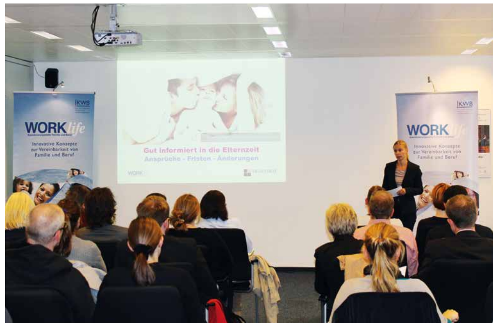
Worklife-Seminar zum Thema Berufsrückkehr.