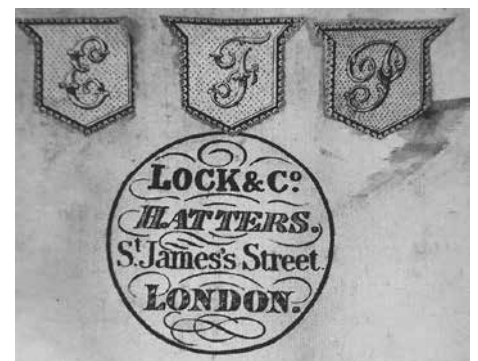
Pulvermann Bowler Firmenzeichen

Das ausgefallene 100jährige Jubi- läum soll aber zeitnahe nachgeholt werden.