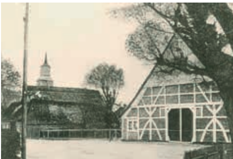
Bild 2. Kröpliens Tischlerei mit Holzlager seitlich des Hauses Ladiges

Nur eines der auf dem wiedergegebenen Gemälde von 1955 abgebildeten Häuser von der vorletzten Jahrhundertwende existiert noch: ganz rechts das Koopmann'sche . Das Haus Ladiges ist verdeckt durch das kleine Instenhaus neben dem großen Haus von Wohlers , das dahinter durch das Haus von Breckwoldt ersetzt wurde. Das Logo des Bürger- und Heimatvereins versucht, das Ensemble des Marktplatzes mit der Kirche in geografischer Verfremdung konzentriert darzustellen (Bild 1).