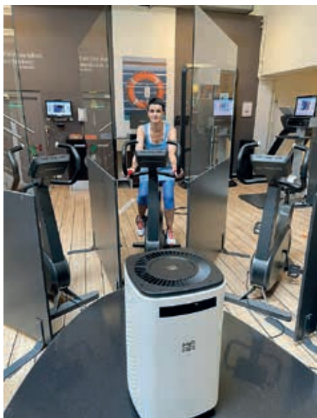
Trennwände zwischen den Sportgeräten und Luftreiniger sorgen für optimale Sicherheit

Nach 7 Monaten Covid-19 Lock-Down durfte das Sportcenter Juka Dojo im Juni endlich wieder die Pforten öffnen. Es wurde in der