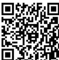
Abteilung Beratung – Vielfalt, Gesundheit, Prävention

Felix-Dahn-Straße 3, 20357 Hamburg, Besucheradresse: Hohe Weide 16, 20259 Hamburg,