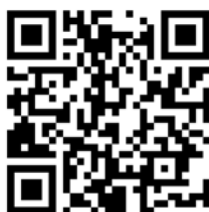
Umwelterziehung und Klimaschutz

Felix-Dahn-Straße 3, 20357 Hamburg Tel.: 040 428842-340 https://www.li.hamburg.de/umwelterziehung