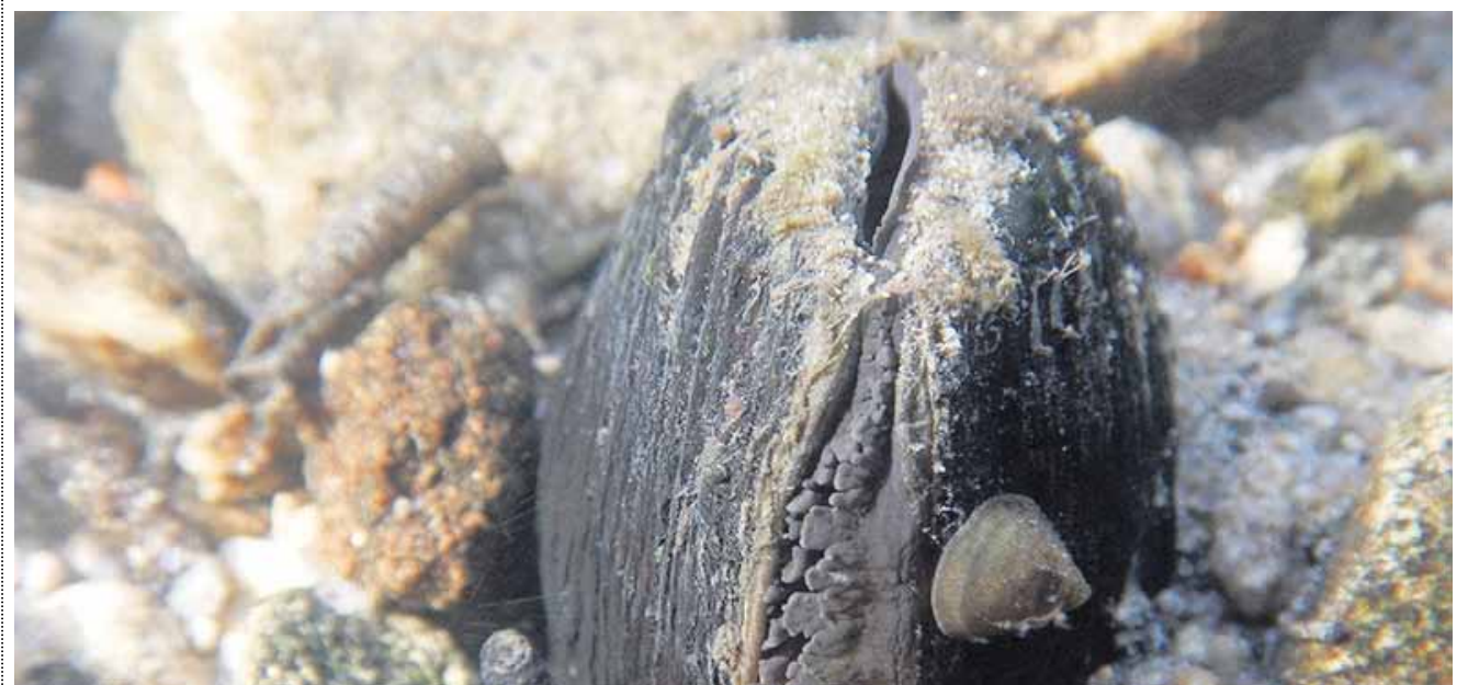
Die Flussperlmuschel ( Margaritifera margaritifera ).