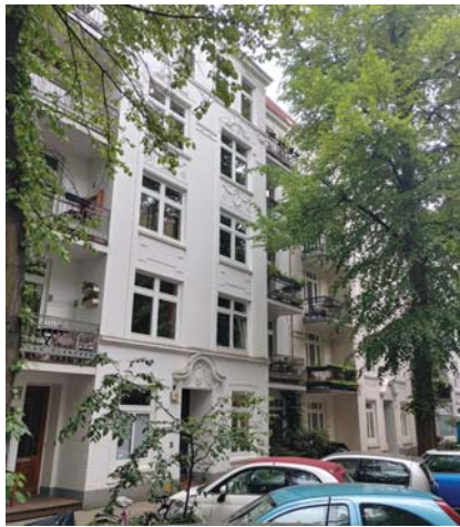
Mehr urbanes Flair geht kaum: Schinkelstraße in Winterhude

Das Flair (von frz.: „Gespür, Witterung“) ist ein Synonym und die Bezeichnung für Atmosphäre, Stimmung und Ausstrahlung. In den Stadtteilen Eppendorf und Winterhude tragen neben den schicken Cafés und den schönen Parks in nicht unerheblichem Maße auch die schönen Häuser mit Jugendstilelementen und die besonderen, teils historischen Gebäude, bei. Damit dieses Flair auch künftigen Generationen erhalten bleibt, hat sich die - etwas sperrig genannte - Städtebauliche Erhaltungsverordnung der Bezirksversammlung bewährt, die jetzt auf weitere vier Quartiere Anwendung findet. Zu den schützenswerten Arealen gehören mit dem Beschluss der Bezirksversammlung vom 20. Mai das Schinkelquartier in Winterhude, die Heilwigstraße, das Gebiet Kösterstraße/Im Winkel in Eppendorf. Als schützenswert wurden auch Straßenzüge an der Grenze von Eppendorf zu Hoheluft-Ost eingestuft. Für ein ausgewiesenes Gebiet bedeutet dies konkret, dass alle baulichen Eingriffe genehmigt werden müssen, und zwar auch dann, wenn nach den bauordnungsrechtlichen Vor-