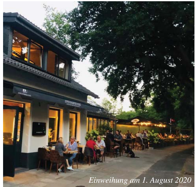
Einweihung am 1. August 2020

Ideen mussten her! Kaffee und Kuchen am Wochenende, Tannenbaum-Verkauf und Glühwein zu Weihnachten. Aber ganz besonders konnten wir uns in dieser Zeit der Stille übrig gebliebenen Baustellen widmen. Es wurde gebohrt, gesägt, geschliffen, gehämmert und gemalt. Überarbeitete Raumelemente, angepasste Konzepte und eine brandneue Barkarte sind entstanden. Dazu unser größtes Highlight: Unsere überdachte Terrasse! Nun geht es endlich wieder los und es gibt viel Platz, um sich bei warmen Temperaturen das kühle Getränk und ein leckeres Gericht schmecken zu lassen. Bei uns seid Ihr vor jedem Hamburger Wetterumschwung bestens geschützt.