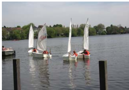
Die Spannung bei den Kleinen steigt, sobald sie im Boot sitzen

Der Alster-Jugend-Segelclub e.V. bietet seit über 20 Jahren Kindern und Jugendlichen eine Segelausbildung an, die Spaß macht. 8-12-jährige lernen im Optimisten und 12-16-jährige im Teeny die Grundbegriffe des Segelns. Es werden Anfänger- und Fortgeschrittenen-Kurse zu äußerst günstigen Kon-