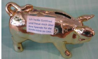
„Gottfried“