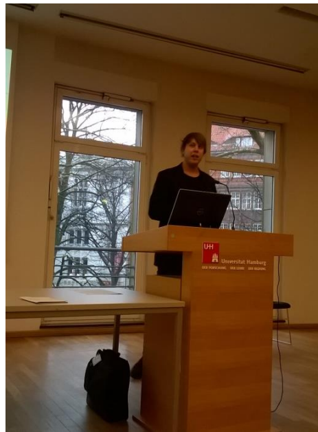
(Abb. 2: Studierende bei der Vorstellung ihrer Projekte)

Die Vorträge der Studierenden wurden anschließend für eine Onlinepublikation ausgearbeitet, die im Dokumentenserver GiNDoc (Germanistik im Netz, http://www.germanistik-im-netz.de/gindok/ ) veröffentlicht wurden. Die Möglichkeit, eigene Projekte sowohl in Form eines Vortrags als auch in schriftlicher Form für andere verfügbar zu machen, wurde von den Teilnehmenden des Projekts sehr begrüßt. Der Austausch von Studierenden über die eigenen Forschungsprojekte und die Möglichkeit, diese sicht- und weiterhin nutzbar zu machen, war auch ein wichtiges Ziel des Lehrprojekts. Dieses Ziel fand auch bei den Studierenden große Zustimmung: Bei der eigens für das Lehrprojekt durchgeführten Evaluation gaben ca. 70 Prozent der Teilnehmenden an, dass die Möglichkeit zur Publikation ein Grund dafür war, am Lehrprojekt teilzunehmen. Ein wichtiger Anreiz für die Teilnahme sei jedoch auch die Perspektive gewesen, mehr über sprachwissenschaftliche Methoden (Datenerhebung und -auswertung) lernen zu können. Zudem gab über die Hälfte der Studierenden an, das Lehrprojekt aufgrund der intensiven Betreuung für das eigene Projekt gewählt zu haben.