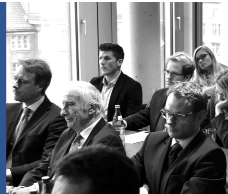
› Interessierte Zuhörer im Plenum