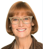
von KATHRIN HERBST Leiterin der vdek-Landesvertretung Hamburg