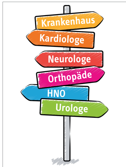
HOHE VERSORGUNGSDICHTE: Hamburg bietet eine große Auswahl an Fachärzten und Kliniken. Dieses Angebot schafft sich seine Nachfrage selbst. Die Folge: Höhere Ausgaben als auf dem Land

Zu den Regeln des Ausgleichssystems zählen aber auch noch zahlreiche weitere Kriterien. Diese Kriterien für die Zuweisung aus dem Gesundheitsfonds, wie etwa die Teilnahme an Disease-Management-Programmen oder der Status eines Erwerbsminderungsrentners, führen zu