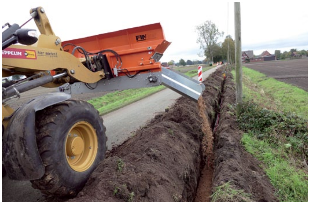
Die Material-Verteilschaufel „Finliner“ von Optimas sandet die Rohrleitungen gleichmäßig und zügig ein.

Wir hatten im letzten Monat fast 30.000 Besucher laut IVW!