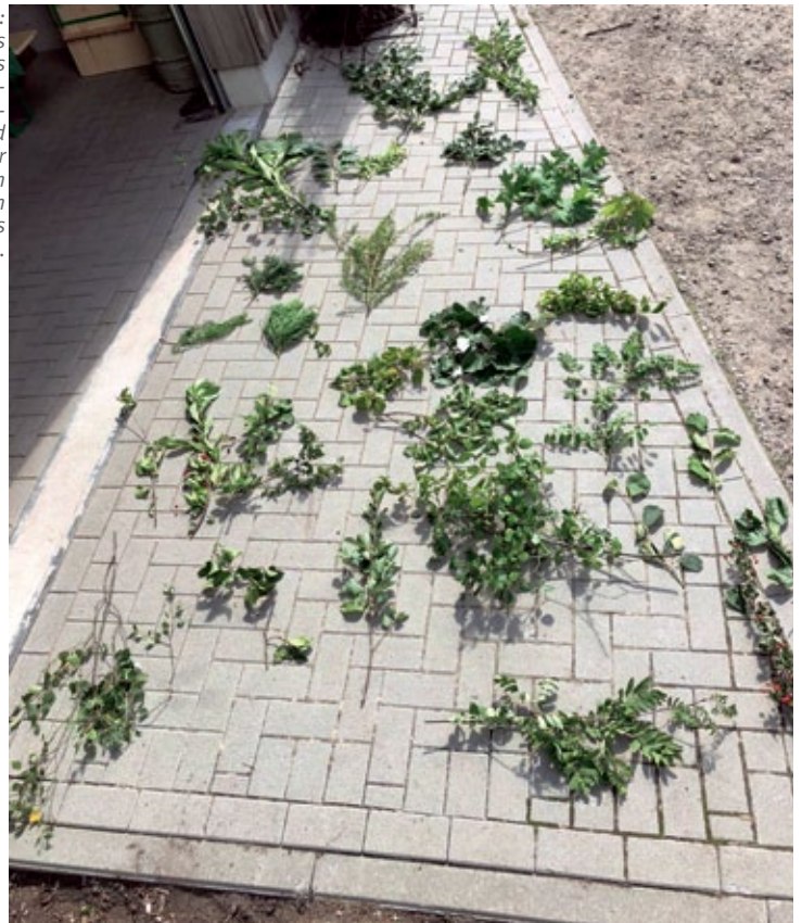
Gesammelte Werke: Im Rahmen ihres Pflanzenkunde-Abos studierten die ange- henden Landschafts- gärtnerinnen und Landschaftsgärtner zahlreiche Stauden und weitere Pflanzen von der Wurzel bis zur Knospe.