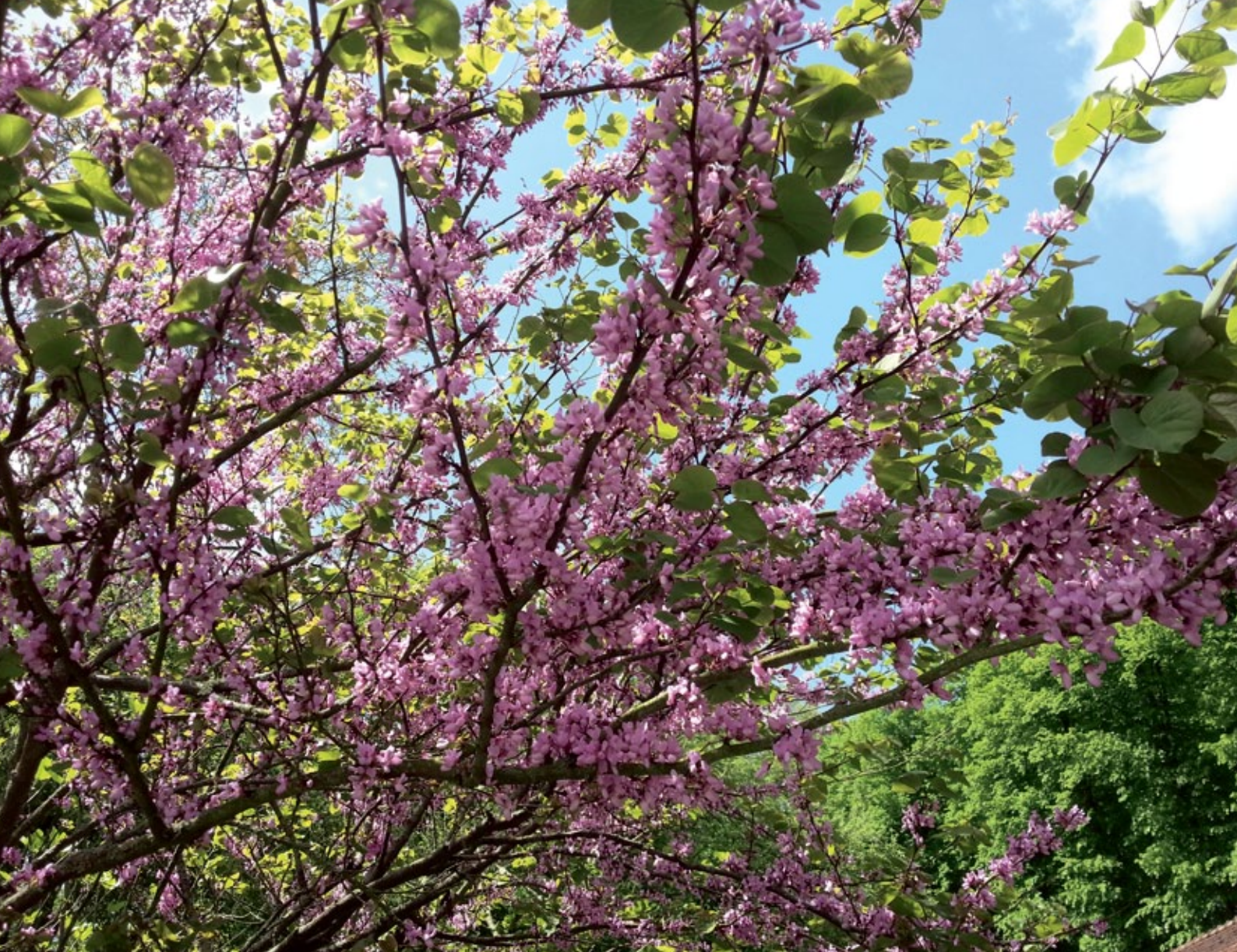
Der Judasbaum stammt aus dem Mittelmeerraum und verträgt von Natur aus hohe Temperaturen. Er bleibt relativ klein und erfreut im Frühling mit pinkfarbenen Schmetterlingsblüten.