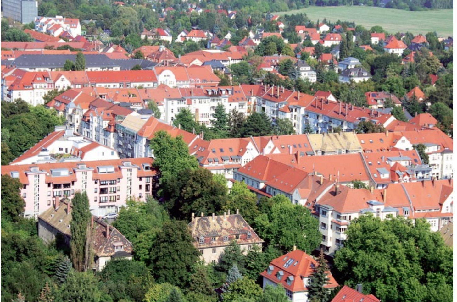
Alle bepflanzten Bereiche einer Stadt bilden zusammen die Grüne Infrastruktur. Dazu zählen große Parks und Schlossgärten ebenso wie Alleeen, Straßenbegleitgrün, Kreisverkehre, Spielplätze, Friedhöfe, aber auch Gärten und Vorgärten.

Der Begriff der „Grünen Infrastruktur“ spielt in den letzten Jahren eine immer präzisere Rolle in Politik und Medien. Ganz neu ist das Konzept nicht: Tatsächlich stammt es schon aus den 1990ern, als in den USA ein starkes urbanes Wachstum enorme Umweltprobleme mit sich brachte. Lösungen mussten her und die Grüne Infrastruktur war die Antwort.