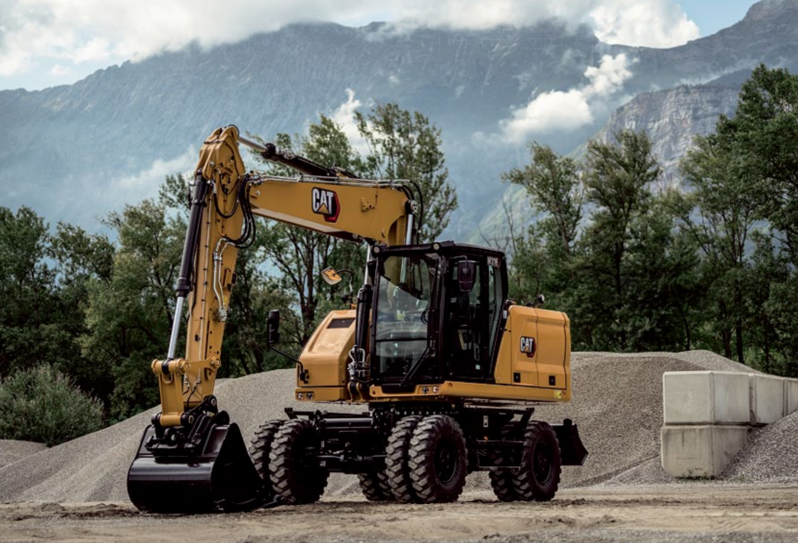
Der neue Cat M316 mit 110 kW (148 PS) und 17 bis 18,5 Tonnen Einsatzgewicht. (Zeppelin Baumaschinen GmbH)