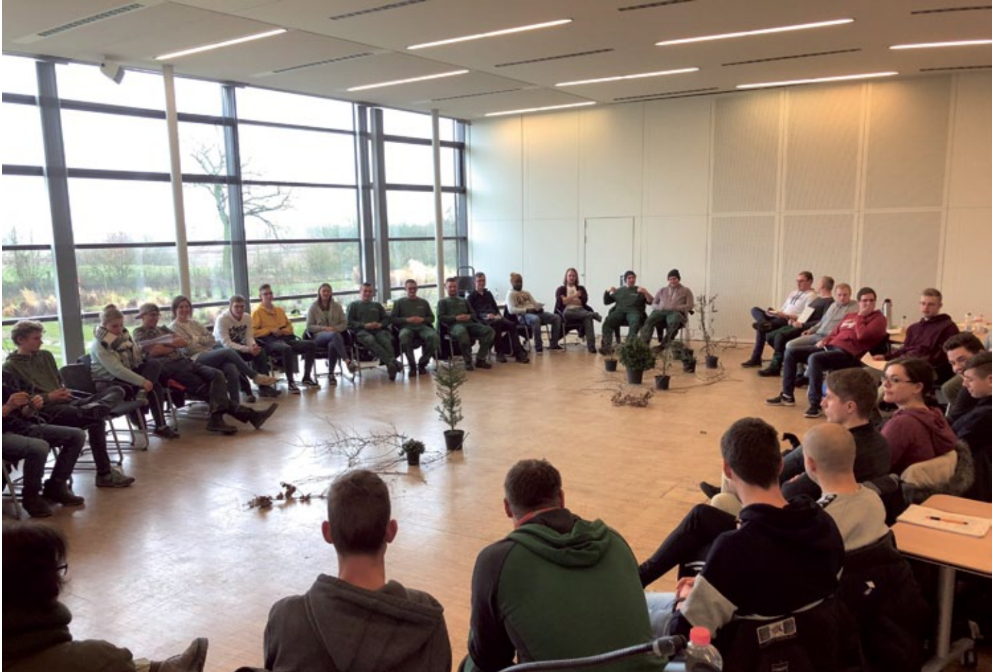
Premiere im Februar: Bei der ersten Schulung kamen alle 40 Pflanzenkunde-Abonnenten im Gartenbauzentrum Ellerhoop zusammen.

In Schleswig-Holstein beschreitet der Fachverband Garten-, Landschafts- und Sportplatzbau innovative Pfade, um bei den Auszubildenden die Begeisterung für die Pflanze zu wecken.