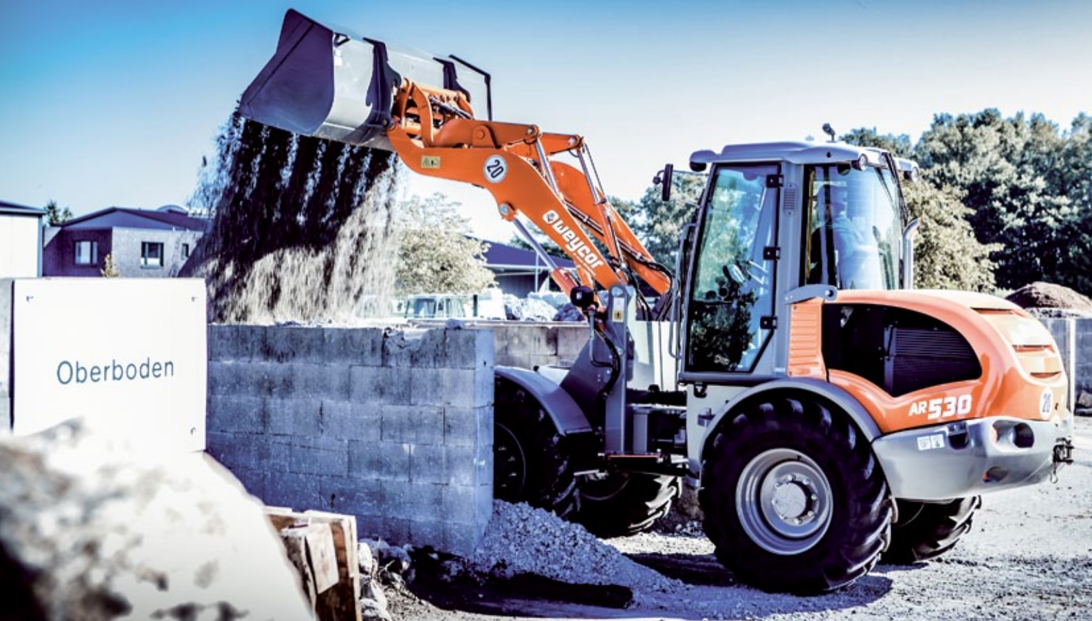
Der weycor AR 530 bietet für alle Einsätze eine ausgezeichnete Leistung und standsicheres Auftreten.