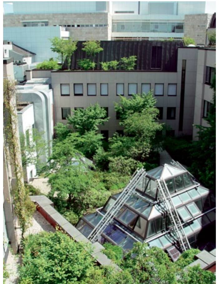
Nicht zu vergessen: die Dachbegrünung sowie vertikales Grün an Hausfassaden und Straßenlärmschutzwänden sind ebenfalls wesentlicher Bestandteil der Grünen Infrastruktur.