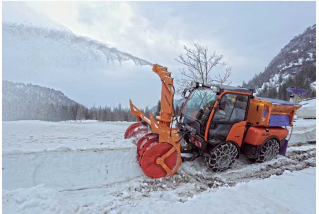
Die neu gegründete Kärcher Municipal GmbH bündelt das komplette Portfolio für Kommunen. Auch unter dem neuen Dach bleiben die Marken Holder und Kärcher mit der jeweils dahinterstehenden Kompetenz sichtbar.

Die Kärcher Municipal GmbH agiert als rechtlich eigenständiger Geschäftsbereich innerhalb der Kärcher-Gruppe am Standort Reutlingen. Zentralfunktionen wie Vertrieb, Produktmanagement, Einkauf und Entwicklung werden zusammengeführt. „Künftig sind wir mit einem kompletten Portfolio für die kommunale Außenreinigung und -pflege am Markt präsent“, sagt Häusermann. Eines der wich-