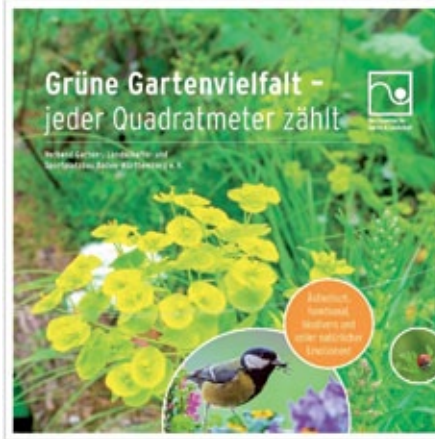
Der VGL hat eine Broschüre mit dem Titel „Grüne Gartenvielfalt – jeder Quadratmeter zählt“ herausgegeben.

Der Verband Garten,- Landschafts- und Sportplatzbau Baden-Württemberg e.V. (VGL) hat eine Broschüre veröffentlicht, die die Wichtigkeit begrünter Gärten und der Biodiversität thematisiert. Baden-Württemberg hat im vergangenen Jahr ein Gesetz zur Änderung des Naturschutzgesetzes verabschiedet, welches ein insektenfreundliches Gestalten und Begrünen regelt, sowie auch die Anlage von Schottergärten verbietet.