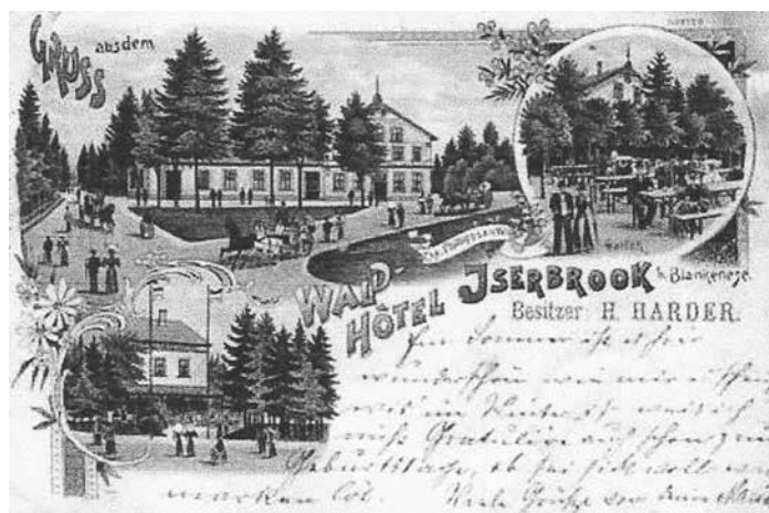
Waldhotel Iserbrook im Jahre 1899

Heute ist Dockenhuden „nur“ noch ein sogenannter „Ortsteil“, zerstreut über mehreren Stadtteile, aber nach