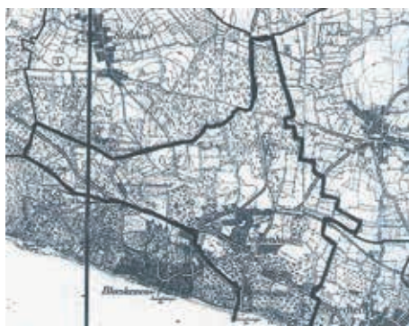
Dockenhuden um 1880

Zu der Zeit war Dockenhuden schon lange kein ausgesprochenes Bauerndorf mehr. Seine Bewohner waren überwiegend im Kleingewerbe und im Handwerk tätig. Landwirtschaft wurde meist nur noch nebenbei betrieben. Es gab auffallend viele Maurer, Zimmerleute und Klempner, die im Baugewerbe arbeiteten. Arbeit gab es genug in der Zeit der Gründerjahre; unter den Dorfbewohnern selber, die größere und modernere Wohnungen und Häuser wollten und dann in den neuen Landhäusern mit den prächtigen Parks. Eine lange Tradition hatten die ansässigen Gärtnereibetriebe, die hauptsächlich Zierpflanzen für