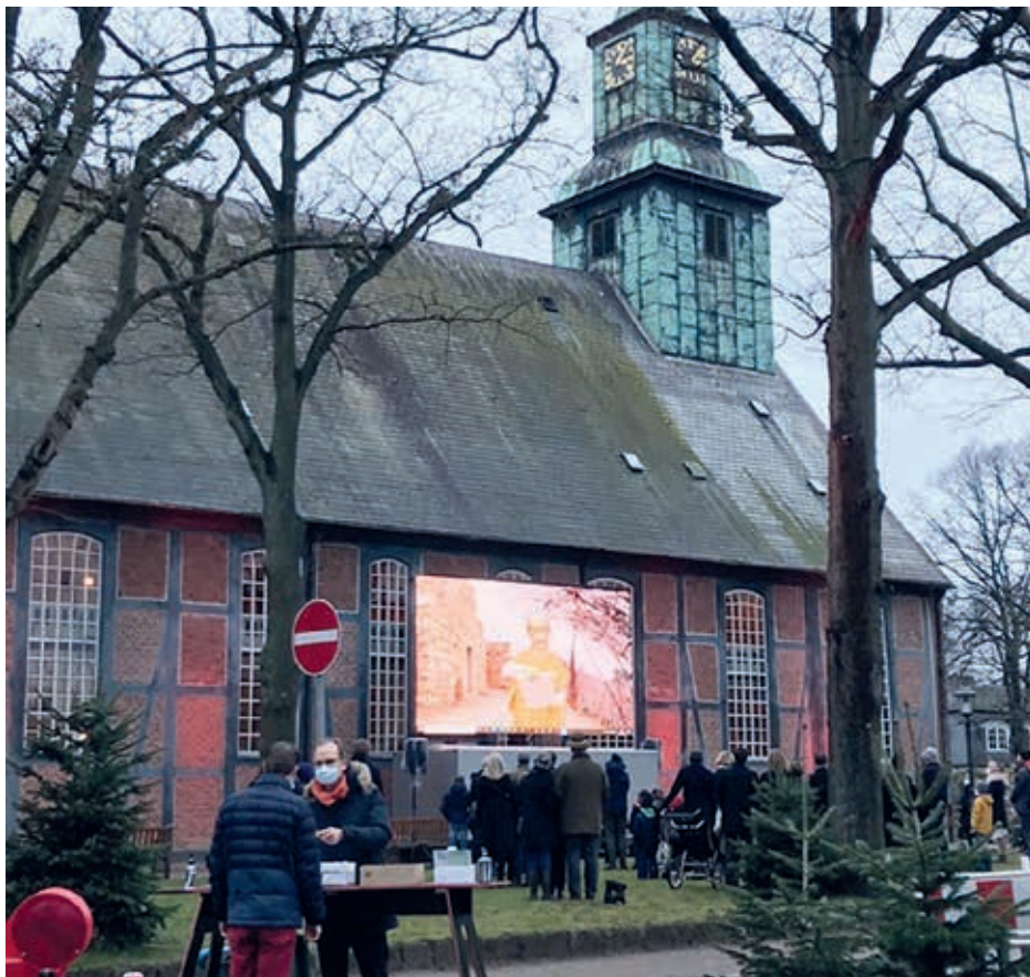
Weihnachtsgottesdienst in Corona-Zeiten