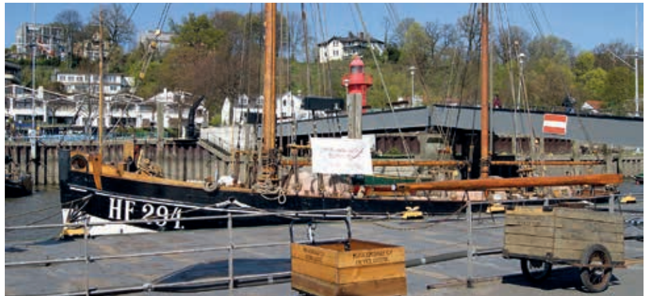
Der Fischkutter „Maltzahn HF 294“ im Oevelgöner Museumshafen

schwert und deshalb untertakelt. Nun baute man ein neues Schwert ein und widmete sich der neuen Takelung. Dafür diente der Segelriss des Hochseekutters Louis und Emma mit einer Gesamtsegelfläche von 320 qm, verteilt auf anderthalb Masten. Noch ein paar Daten: Die aus Eichenholz gebaute HF 294 ist 30m lang, 6,80 m breit, hat einen Tiefgang von 2,50 m und verfügt über einen Hilfsmotor von 180 PS.