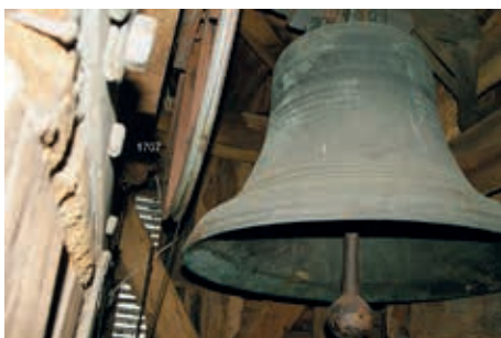
Die älteste Glocke unserer Nienstedtener Kirche

Übrigens berühmt wegen ihres schönen Klanges sind an zweiter, dritter und vierter Stelle die Glocken des Erfurter Doms sowie des Ulmer und Straßburger Münsters. Falls