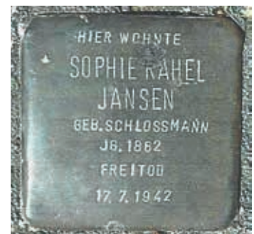
Stolperstein für Sophie Jansen in der Blankeneser Hauptstraße 56