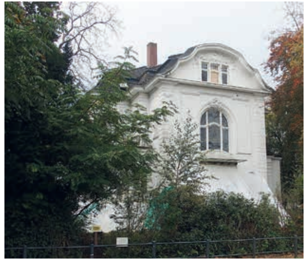
2017: die Sanierung stockt