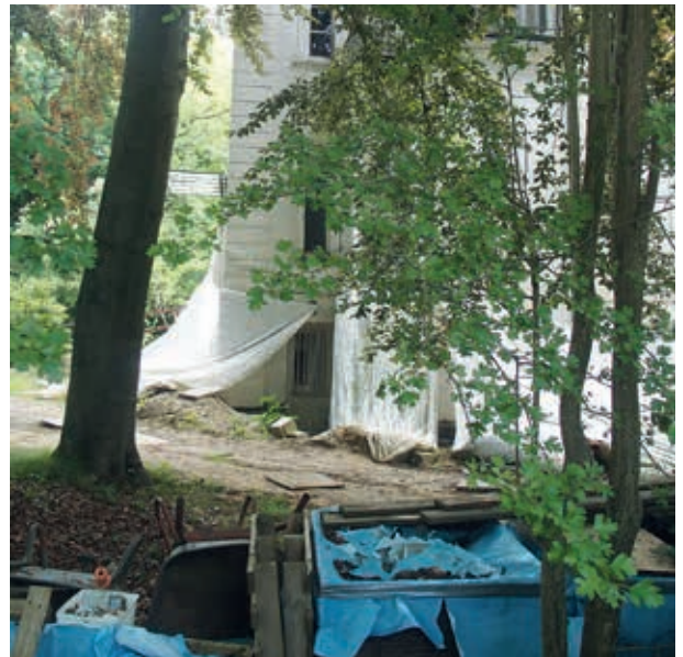
2007-20: Eingang zugewachsen, keine Baufortschritte zu sehen...