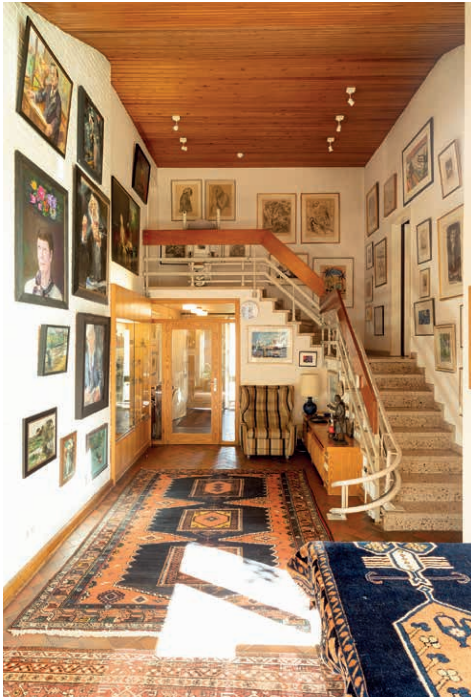
Das Haus der Schmidts in Hamburg-Langenhorn: Treppenaufgang