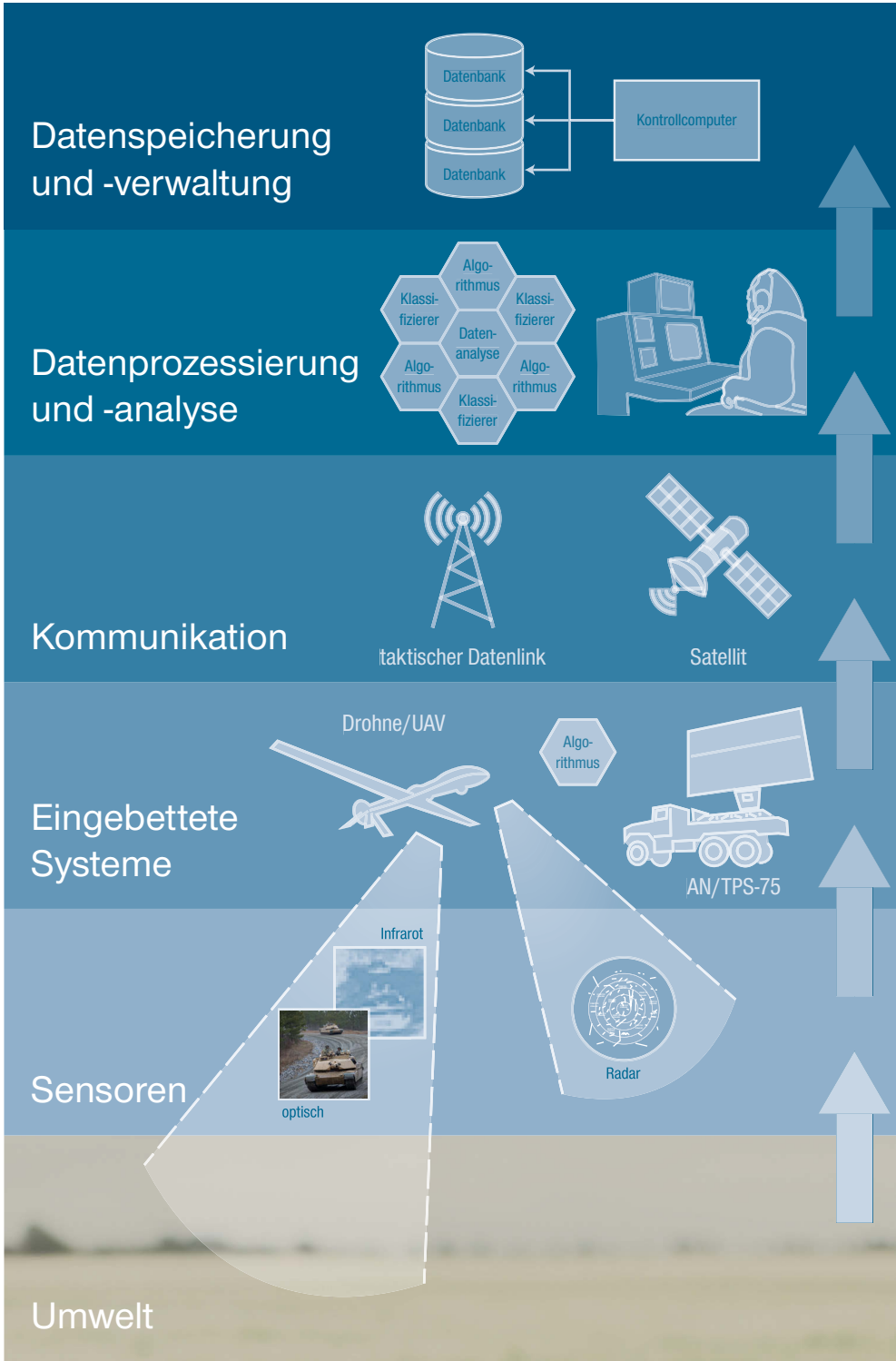
Abbildung 1: Prozess militärischer Informationsgewinnung