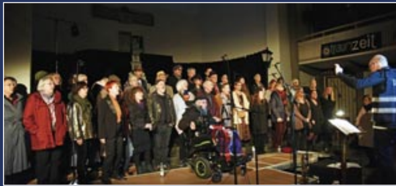
Drachengold-Chor in der Revue „Der Mond ist ausgegangen“, November 2019