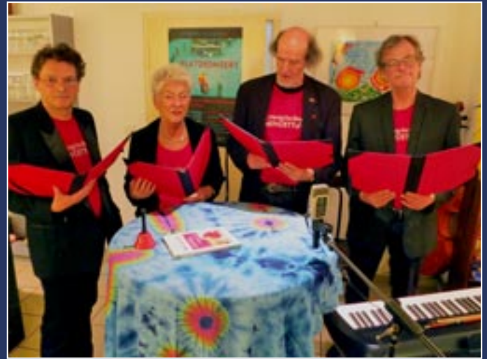
Literarisches Menüett, „Platzkonzert“, Februar 2020