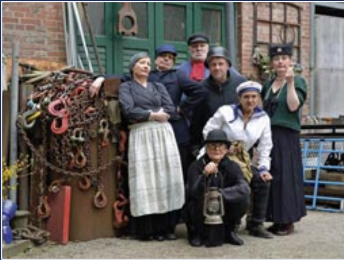
Vorstadttheater St. Georg, Szenischer Rundgang, Mai 2019