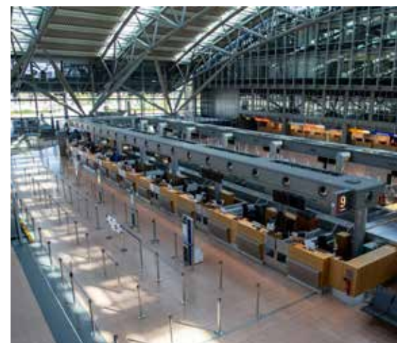
Klimaschutz muss auch ohne Lockdown funktionieren

wie ein kostenloser HVV würden Mobilität für alle ermöglichen und den Autoverkehr reduzieren. Es ist notwendig, alle Gebäude in Hamburg energetisch zu sanieren – allerdings sollten die Kosten nicht auf die Miete aufgeschlagen werden dürfen.