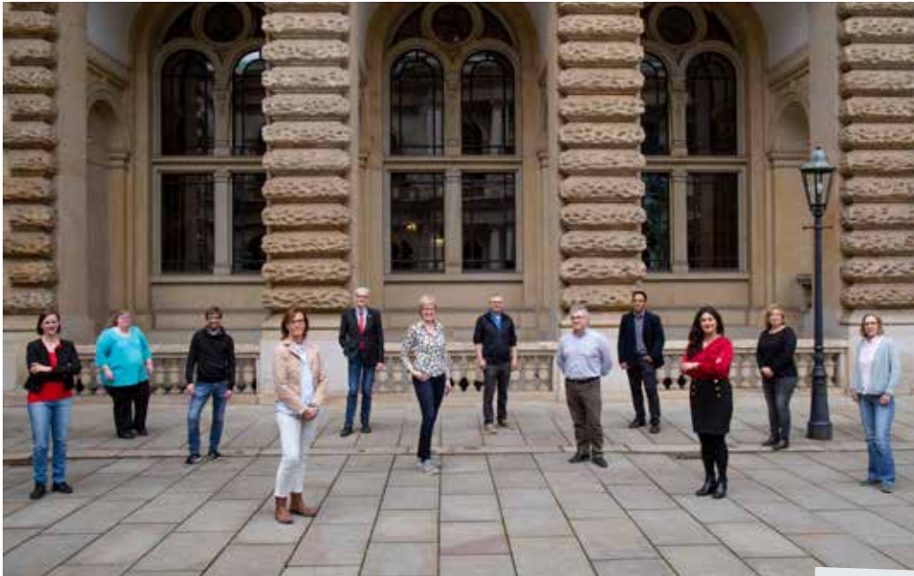
Mit Abstand am besten: die 13 Abgeordneten der LINKEN vor dem Hamburger Rathaus (beim Fototermin fehlte Mehmet Yildiz)