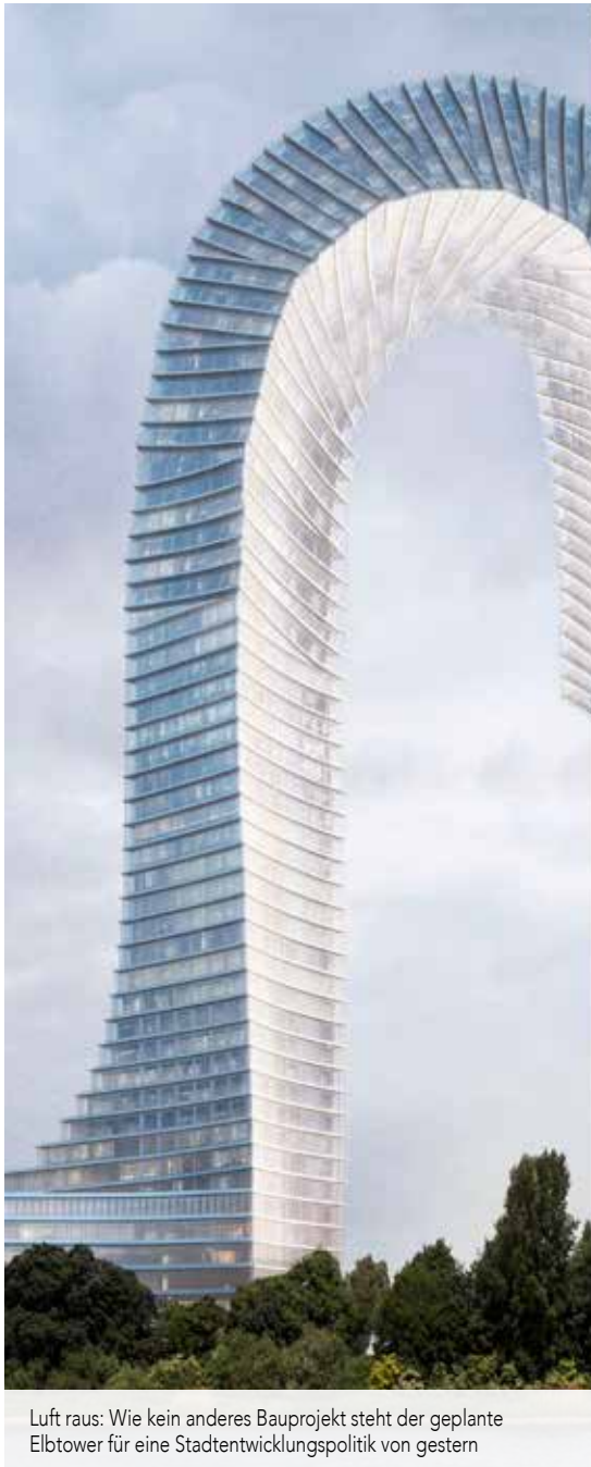
Luft raus: Wie kein anderes Bauprojekt steht der geplante Elbtower für eine Stadtentwicklungspolitik von gestern

Nicht nur der geplante Elbtower ist ein Flop. Auch an der Sternbrücke, am Diebsteich und auf dem Grasbrook wird unsere Stadt gerade gehörig verschandelt. Der Senat nutzt die Corona-Krise, um die umstrittenen Bauvorhaben ohne vernünftige Beteiligung durchzuziehen