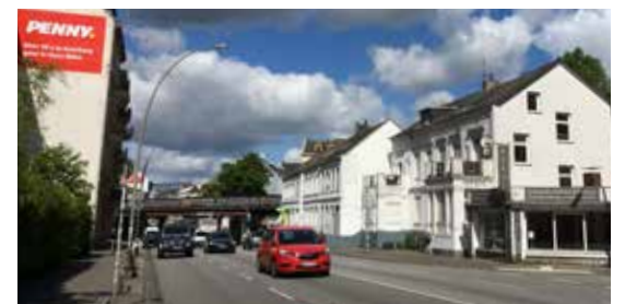
Die alte, schlanke Sternbrücke...

Ganz ähnlich auch der Umgang des Senats mit der Planung für den Schulcampus Lohsepark . Hier hat die öffentliche Auslegung des 540-seitigen, umstrittenen Bebauungsplan-Entwurfs „HafenCity 10“ mitten im Corona-Lockdown stattgefunden. Ein Unding, denn Beteiligung wurde so nahezu ausgehebelt. Zeit für eine neue, bessere Stadtentwicklungspolitik!