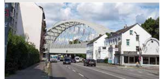
... soll durch eine gigantische Konstruktion ersetzt werden