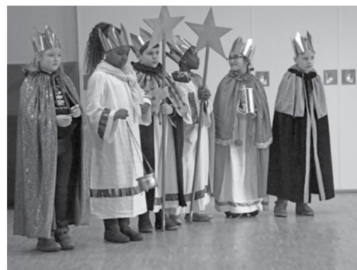
Weihrauch und Segen brachten die Sternsinger auch den Kindern der Kita im Stadtteilhaus Lurup.

Bitte anmelden bis 31.1., Tel. 040 83 10 21.