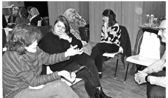
Regier Austausch in Kleingruppen beim Runden Tisch Gesundheitsförderung

Aber in der Familie wird auch Stress erlebt, z. B. „im Kontakt mit den Kindern, weil ich eine