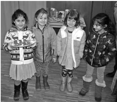
Gastfreundschaft in der Schule Langbargheide: Die Wölfe-Klasse hat leckere Obststücker für den Runden Tisch zubereitet.

Im November 2017 befassten sich beim Runden Tisch Gesundheitsförderung Lurup/Osdorfer Born 40 Engagierte mit dem Thema „Förde-