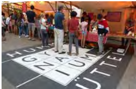
▲ Sommertreff Gymnasium Hummelsbüttel 30.08.

Das Sommerfest, das in diesem Jahr zum 9. Mal stattfand, stand ganz im Zeichen des Stadtteil-Jubiläums „700 Jahre Hummelsbüttel“.