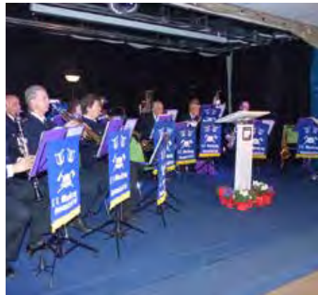
▲ Musikzug Freiwillige Feuerwehr Hummelsbüttel