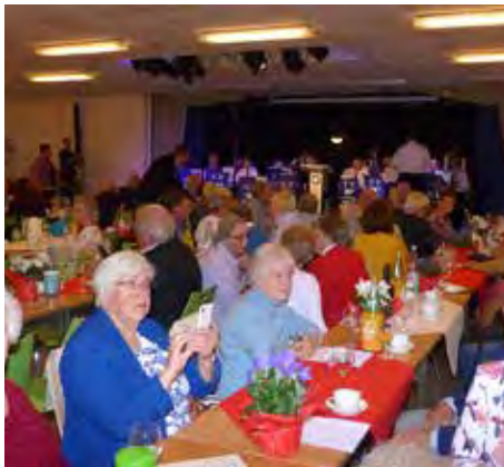
▲ Jubiläumsfeier 07.09.