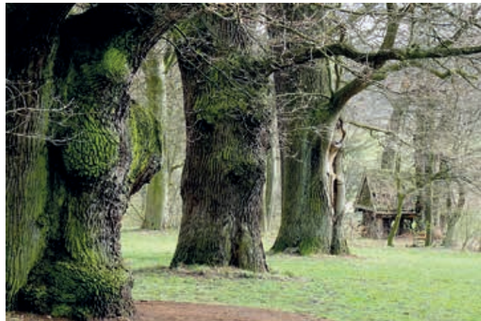
Eichen im Jenisch-Park (E. Eichberg)

Schanz eine Eiche aus dem Jahre 1810. Heute besitzt sie einen Kronendurchmesser von 20 Metern bei fast 5 Metern Stammumfang. Da sie sich ihren Standort nicht an einer Rennstrecke für Autos ausgesucht hat, besitzt sie durchaus die Chance nochmal so alt zu werden. Riesige Narben in der Borke mancher Eiche zeugen von längst vergangenen Gewittern. Meistens steckt der Baum so einen Blitzeinschlag weg und mit den Jahren wächst die Wunde wieder zu. Und wenn nicht: Eichenholz ist verdammt wetterbeständig. Gelegentlich haut es so einen Riesen aber doch vom Sockel. In der Up de Schanz gegenüber der Einmündung von Dammannweg und Blechschmidtstraße stehen zwei dicke Eichen, aber einst waren es drei. Zu Beginn der 60er Jahre warteten wir vor der Abendblatt-Agentur Klingbiel darauf, dass der Gewitterregen endlich aufhörte, damit wir mit unserer Zeitungstour beginnen konnten. Ich habe ihn mit eigenen Augen gesehen, den Blitz, der von einem ungeheuren Knall begleitet wurde. Es muss einer von der stärkeren Kategorie gewesen sein, die bis zu einer Stromstärke von einer halben Million Ampere reichen können. Am Abend bin ich hingera-