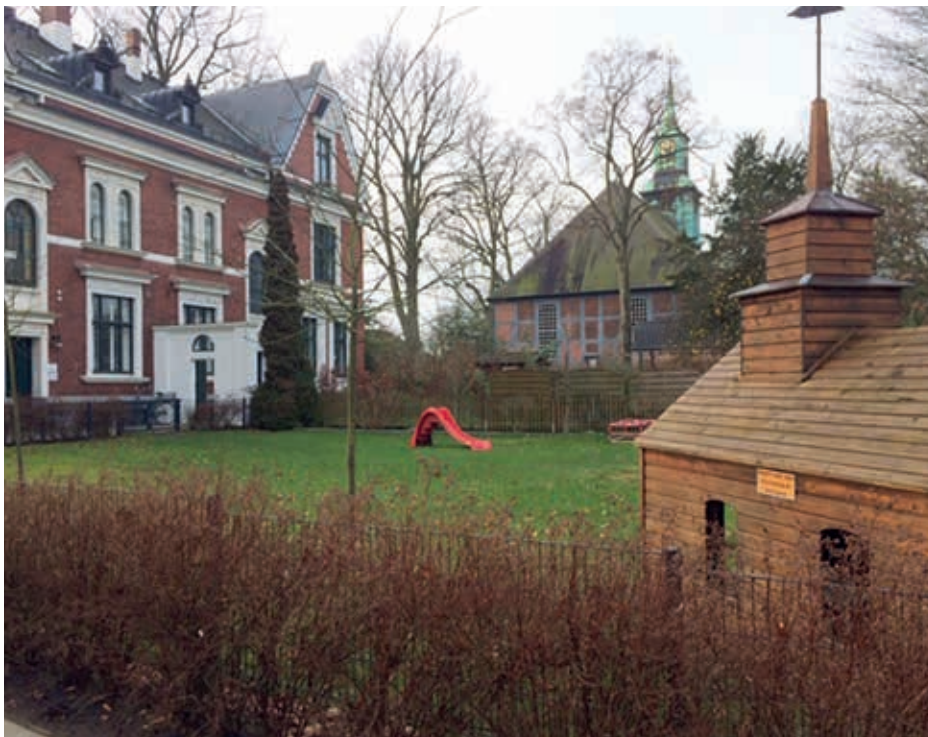
Das Pastorat von der Nordseite

Der Vollständigkeit wegen, darf nicht unerwähnt bleiben, dass man sich seit den 30er Jahren bereits Gedanken gemacht hatte, wie man die noch verbliebene Gemeinde von Klein Flottbek geistlich versorgen könnte. So führte man im Saal des Konservatoriums am Hoch-