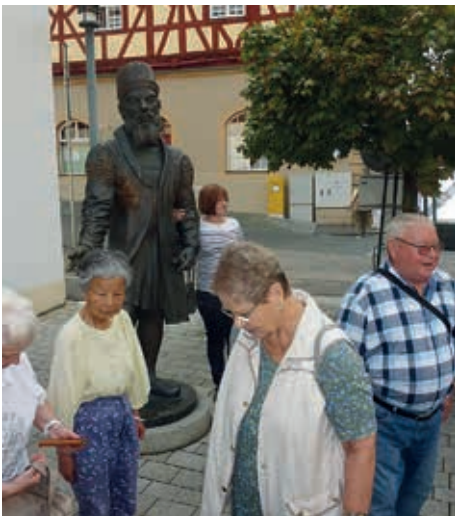
Umringt von Billstedtern: Rechenkünstler Adam Riese

Fluss überquerten wir mit einer Fähre. In Dettelbach bummelten wir durch die wunderschöne mittelalterliche Kleinstadt mit ihrer prachtvollen Stadtmauer. Dann ging es ein kleines Stück weiter in den Ort Sulzbach. Auch er eine absolute