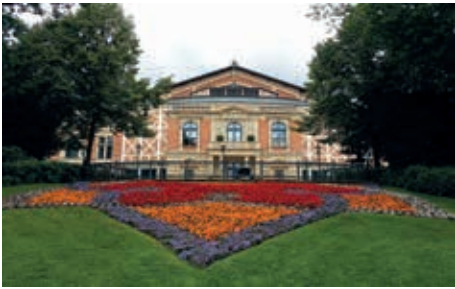
Bayreuther Festspielhaus auf dem grünen Hügel

Bamberg. Hier am Zusammenfluss der Regnitz mit dem Main befindet sich eine der schönsten und besterhaltenen mittelalterlichen Städte Deutschlands.