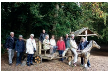
Beten Spaß gehört dato: „Wanderpony“ am Wanderweg

Am letzten Septemberwochenende trafen sich einige Wanderlustige des Bürgervereins, um den Weg zum