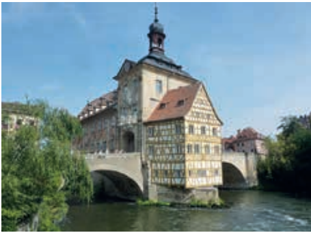
Altes Rathaus Bamberg auf der Regnitz-Brücke, dahinter liegt „Klein-Venedig“