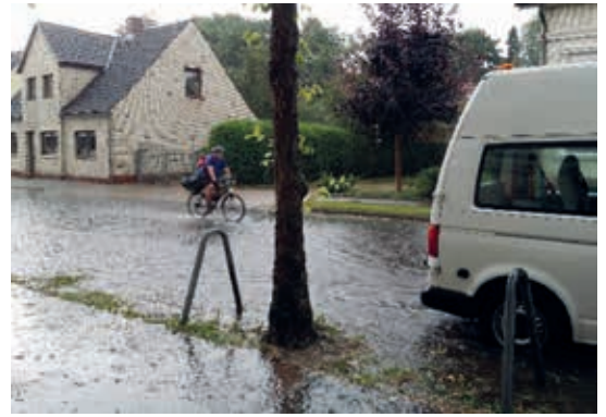
Starkregenereignis im Juli 2016. Die Merkenstraße glich einem Flusslauf...

eingebaut, die im Falle eines heftigen Platzregens rund 500 Kubikmeter Regenwasser aufnehmen und so das vorhandene Regenwassersiel entlasten würden. Klima-Simulationen des Deutschen Wetterdienstes für Hamburg sowie die Erfahrungen der vergangenen Jahre hätten gezeigt, »dass wir unsere Stadt klug und weitsichtig an die Klima-Veränderungen anpassen müssen«, sagte Umweltsenator Jens Kerstan (Grüne) bei der Präsentation. Die Anlage sei bundesweit einmalig.“