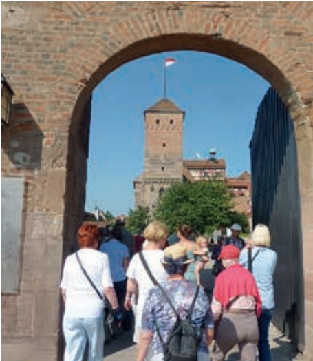
Die Billstedter erstürmen die Nürnberger Burg, dessen „Heidenturm“ die Frankenflagge schmückt