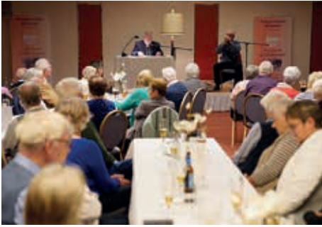
Gemütlich und entspannt im Panorama