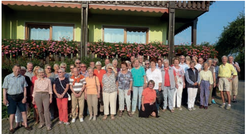
Gute Laune inklusive: Gruppenbild vor dem Hotel

Der Gästeführer konnte viele Einzelheiten, etwa über den Rosengarten (nach Entwürfen von Balthasar Neumann), der Neuen Residenz mit ihrer „Lüftel-Malerei“-über den Fenstern, den Bamberger Dom, die Alte und die Neue Hofhaltung und vieles mehr nahebringen.