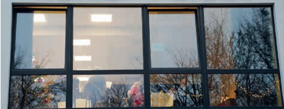
da wird sogar der KulturPalast ganz feierlich...