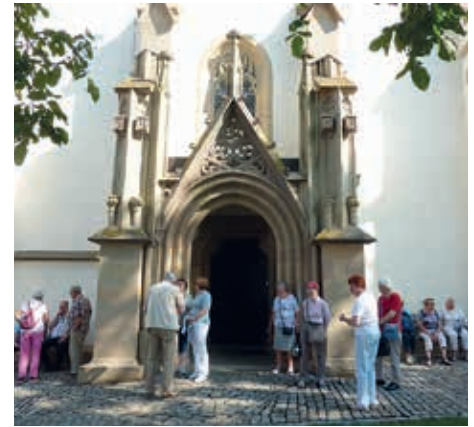
Wallfahrtskirche Maria im Weingarten mit der Rosenkranz-Schnitzerei von Tillmann Riemenschneider