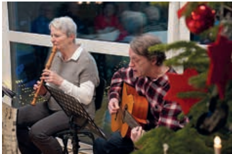
Gesang mit Flöten- und Gitarrenbegleitung

Freitag, 6. Dezember, 15:00 bis 17:30, mit dem Bürgerverein Billstedt im Kulturpalast Billstedt, Öjendorfer Weg 30a