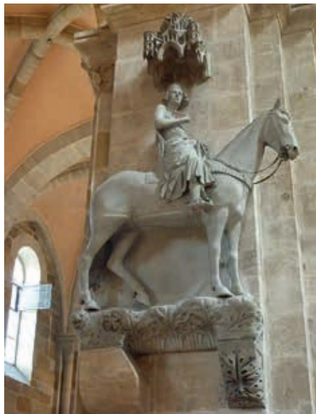
Sehr bekannt: Der Bamberger Reiter im Dom St. Peter und St Georg

Der nächste Reisetag führte uns in die großartige Reichsstadt Nürnberg mit ihren prächtigen Plätzen und Bauwerken. Nach der Anreise über die Autobahn unternahmen wir zunächst einen geführten Rundgang durch das geschichtsträchtige Stadtzentrum. Die Dürer-Stadt beeindruckt durch ihre Burganlage, dem Altstadt kern und dem Hauptmarkt, auf dem seit 1628 der Christkindlesmarkt ausgerufen wird. Seitdem spricht das „Christkind“ alljährlich: „Ihr Herrn und Frau'n, die Ihr einst Kinder wart, seid es heut wieder“, wenn es zur Eröffnung des Nürnberger Christkindlesmarktes