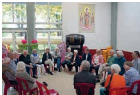
Aufmerksam lauschte die Besuchergruppe den Antworten der Gastgeber

Der letzte September-Sonntag kam etwas verregnet daher. Und doch, als die knapp zwanzig Personen der Besuchergruppe von Wir für Billstedt die „Rote Brücke“ über die Bille passierte, wirkte es ein wenig, als wäre die Bille die kleine Schwester des Mekong. Durch den Anbau typischer