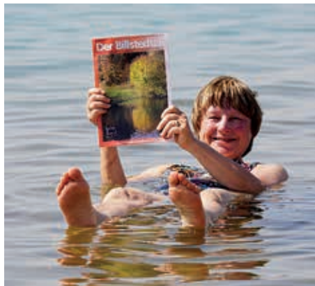
Hier lässt sich gut treiben – bei der Lektüre von Der Billstedter im Toten Meer

Eine besinnliche Adventszeit wünscht Ihnen DerBi