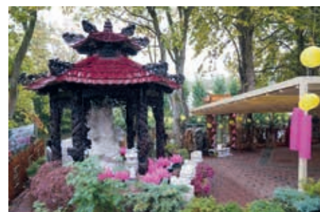
Die Außenterrasse der Pagode liegt direkt an der Bille