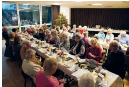
Auch die eine oder andere Weihnachtsgeschichte gibt es zu hören