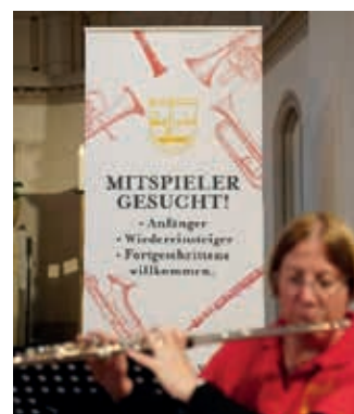
Frommer Wunsch der Bille-Bläser

Sonnabend 14. Dezember 17:00Uhr, Steinbeker Kirche