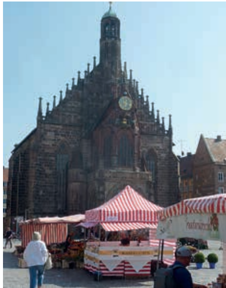
Auf dem Balkon der Nürnberger Frauenkirche am Hauptmarkt wird alljährlich der Christkindles-Markt ausgerufen