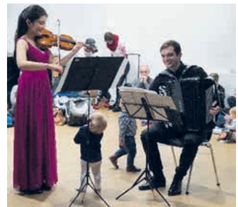
„Leiser“ Applaus per Händewinken...

Anmeldung unter www.babykonzert.de bzw. www.minikonzert.de .