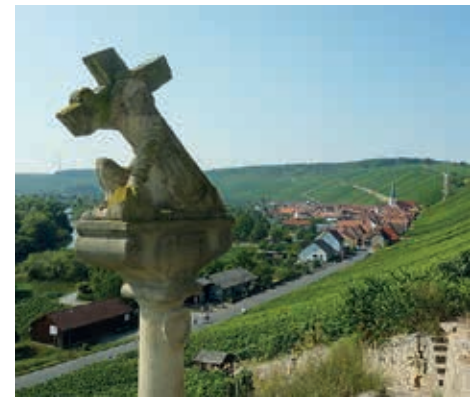
Der Abstieg durch die sonnigen Weinberge an der Volkacher Mainschleife war ein erwärmendes Erlebnis!