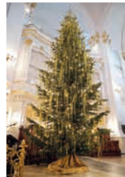
Tadellos der Weihnachtsbaum im Hamburger Michel