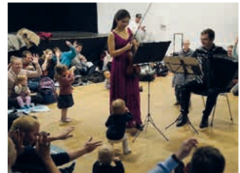
Stauende Zuhörer wollen dahin, woher die Töne kommen...

Ein ganz anderes Publikum fand sich am ersten November-Sonntag ein: Junge Familien und Großeltern mit ihren kleinen Kindern und Enkeln. Auf Kuscheldecken nahmen die Zuhörer Platz und lauschten den klassischen Melodien des „Devion Duos“. Dabei wird den Kleinen Raum für ihren Bewegungsdrang gelassen, d.h. sie können die Musiker „hautnah“ bestaunen. Als Anerkennung erhalten die Musiker „leiser Applaus“ durch Händewinken, damit die jungen Musikneulinge nicht verschreckt werden.