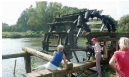
Echter Frauen-Magnet: Wasserschöpfrad bei Möhrendorf an der Regnitz