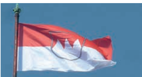
Überall zu sehen: der Dreizack der Franken-Fahne...