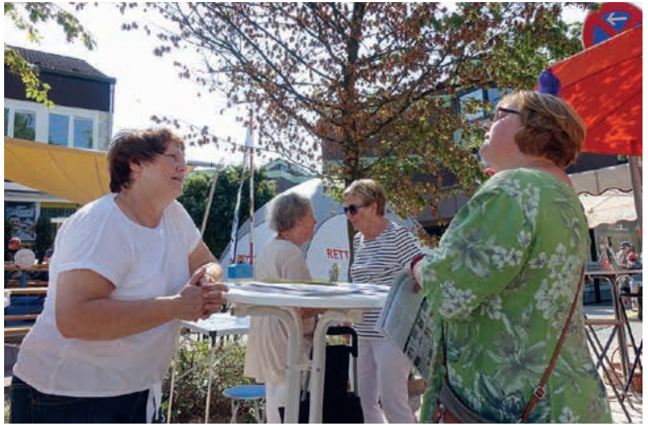
Perfektes Wetter, perfekte Gespräche, ein guter Tag für Volksdorf

Das Wetter war optimal. Am Abend zuvor hatte der Bürgerverein die Kleinen zu einem großen Laternenumzug eingeladen. Unter Begleitung von Spielmannszug, Polizei und Feuerwehr ging es bei fröhlichen Liedern in die Horst, wo für die Kinder der Abend mit einem grandiosen Feuerwerk ausklang. (EL)