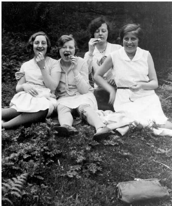
Fotos erinnern an vergangene Zeiten, sind wie ein Fenster in die Vergangenheit.