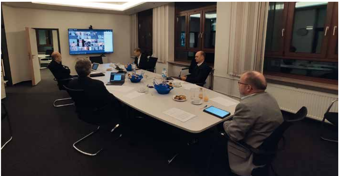
Versammlung unter Beachtung der Corona-Hygieneregeln: die Schaltzentrale der Online-Vertreterversammlung

Überhaupt sei Selbsthilfe, Kreativität und Eigeninitiative gefragt gewesen. So hätte die KZV Hamburg – als FFP2-