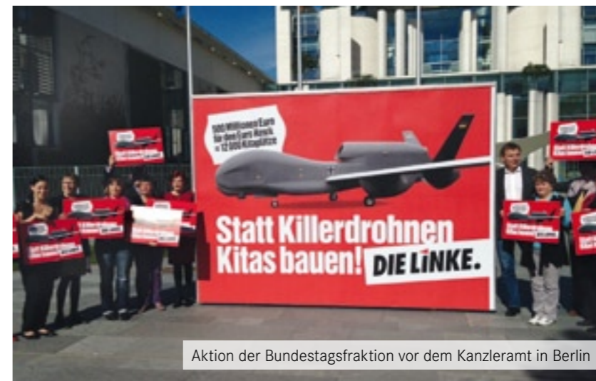
Aktion der Bundestagsfraktion vor dem Kanzleramt in Berlin