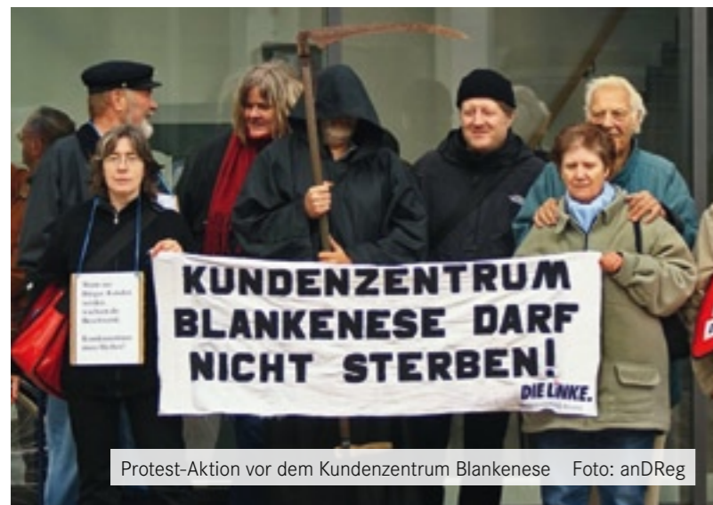
Protest-Aktion vor dem Kundenzentrum Blankenese

Einmal mehr zeigt sich die fatale Wirkung der Schuldenbremse vor Ort. Die Kundenzentren sind in den Focus der Kürzungspolitik des SPD-Senats geraten. 2011 haben die sieben Bezirksamtsleiter ein gemeinsames Projekt zur Optimierung der Kundenzentren - abgekürzt „OptiKuZ“ - eingesetzt, um Ende 2013 ein neues Standortkonzept für den Bürgerservice vorzulegen. Konkret geht es darum, den Kahlschlag beim Bürgerservice vorzubereiten: Jedes zweite Kundenzentrum soll schließen, meldete das Hamburger Abendblatt (Ausgabe vom 27.4.2013). Von stadtwweit derzeit zwanzig