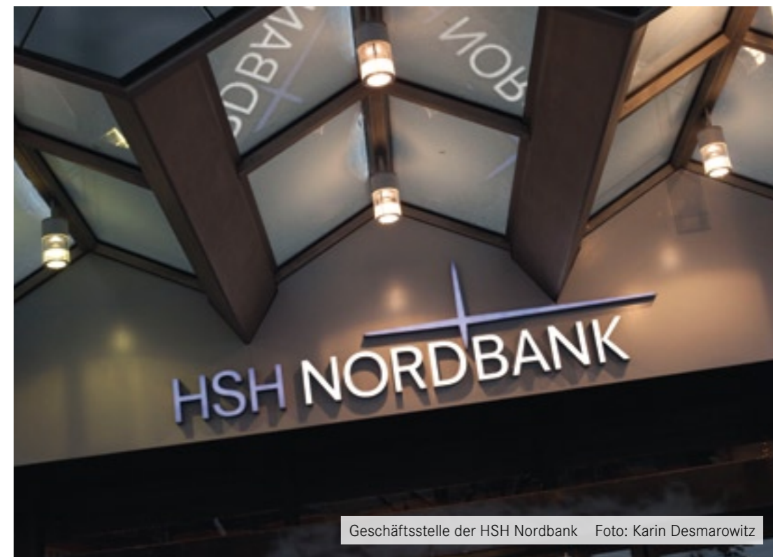
Geschäftsstelle der HSH Nordbank

als deutliche Abtrennung vom bisherigen Geschäftsfeld einer Landesbank. Wegen der wachsenden Probleme auf den