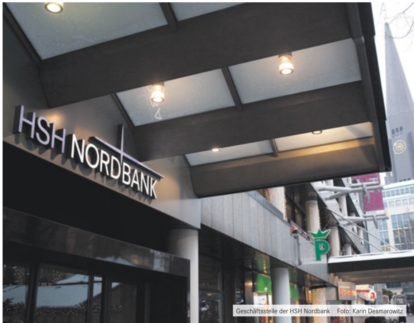
Geschäftsstelle der HSH Nordbank

sowie gewinnerhöhende Auflösungen von dringend notwendigen Risikovorsorgepositionen.