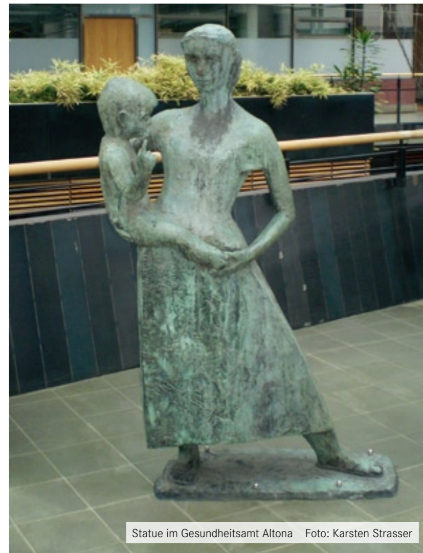
Statue im Gesundheitsamt Altona

versammlung beschlossen werden konnte, ist er mehrfach zwischen dem zuständigen Fachausschuss und der Bezirksversammlung hin- und her verwiesen worden. Am Ende ist der Antrag