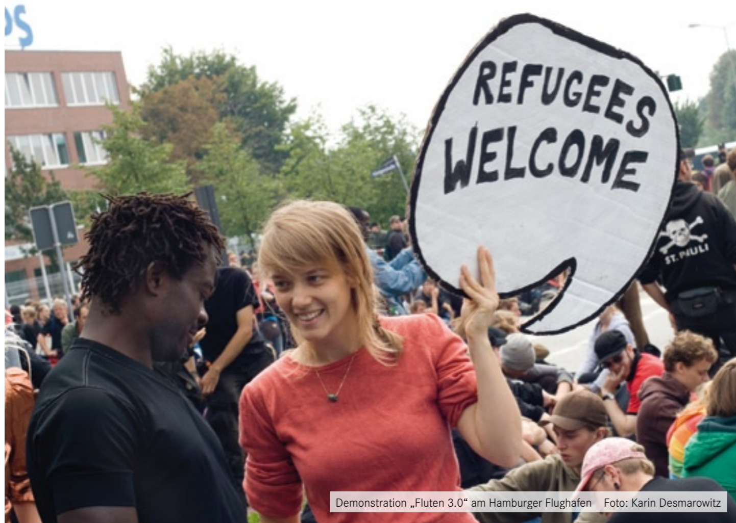
Demonstration „Fluten 3.0“ am Hamburger Flughafen

Hauptausschuss der Altonaer Bezirksversammlung und fragte an, ob die BV auf dem Durchreiseplatz der Rom- und Cinti-Union einer bis zum 31. März befristeten Unterbringung in Containern und Zelten zustimmen könne. Dies wurde auch von Der Linken mitbeschlossen, nachdem klargestellt war, dass die Rom- und Cinti-Union in diesem Zeit-