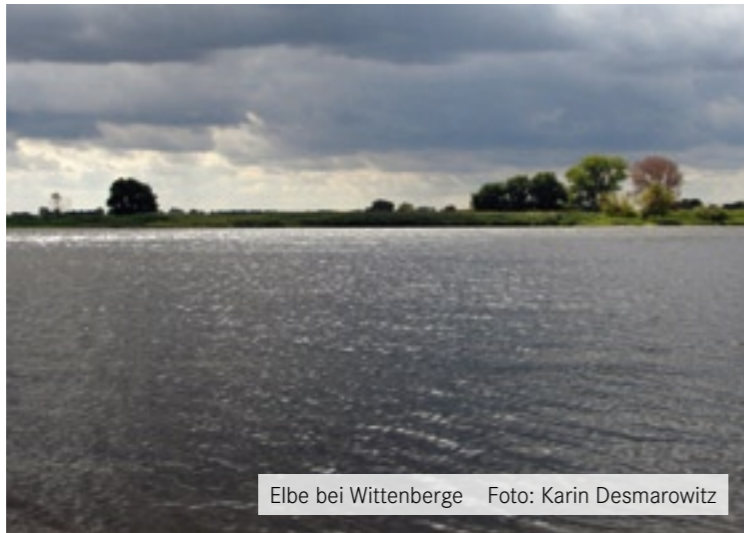
Elbe bei Wittenberge

Zunehmend dramatisch ist die Klimaentwicklung, welche die Stärke und Häufigkeit von Starkregen, Dürrephasen, Hitzeperioden, heftigen Stürmen usw.