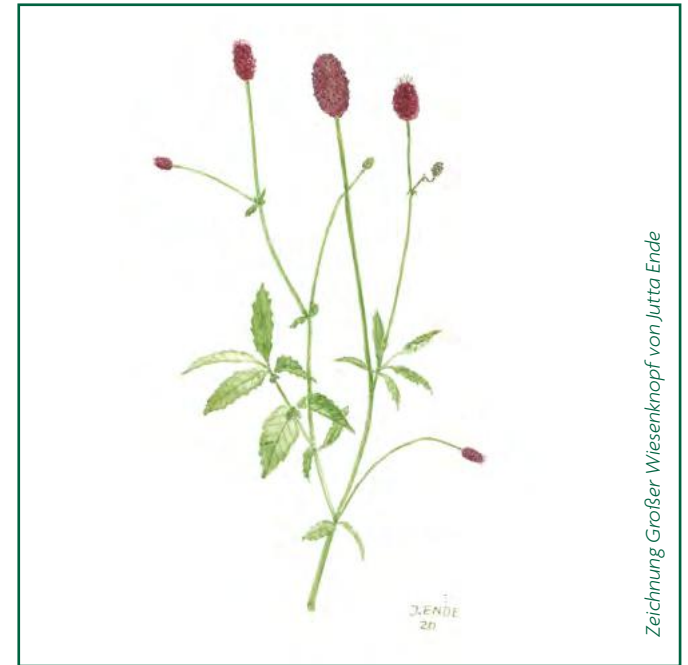
Zeichnung Großer Wiesenknopf von Jutta Ende

Geschäftsführer Axel Jahn Steintorweg 8 · 20099 Hamburg Telefon 040 243 443 info@loki-schmidt-stiftung.de loki-schmidt-stiftung.de