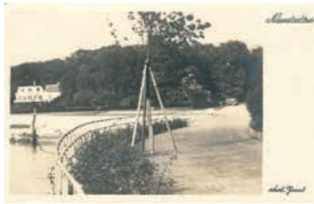
Abb. 2. Teufelsbrücker Hafen in den 1930er (?) Jahren