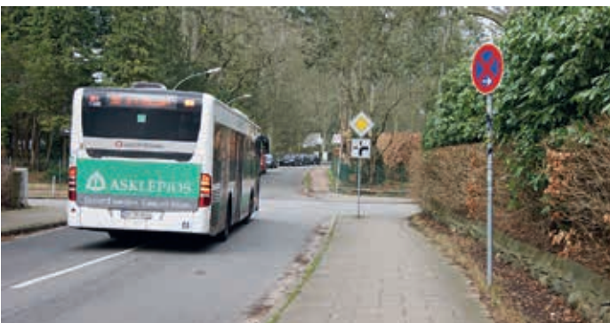
Foto 2: Abknickende Vorfahrt an Up de Schanz/Richtung S Bahn Hochkamp

Nun zu meiner „ Abknickenden Vorfahrt “ Up de Schanz / Richtung S-Bahn Hochkamp (Foto 2). Rein rechtlich