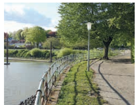
Abb. 3. Die gleiche Perspektive Mai 2020