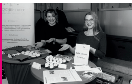
Das Projekt „Dolle Deerns“ stellte sich im Foyer vor