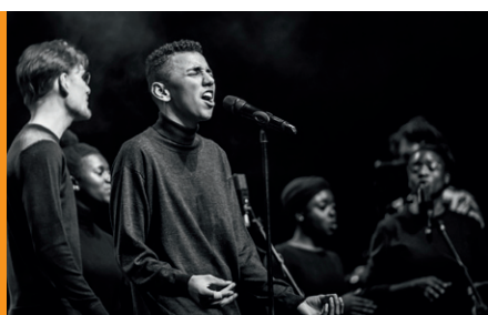
Gefühlvollen Soul brachte der Chor von „Lukulule“ mit