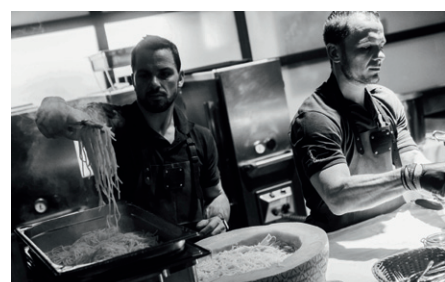
Die Firma EventCater spendierte das vorzügliche Essen