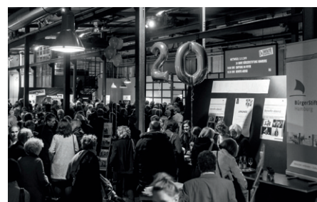
850 Gäste waren der Einladung nach Kampnagel gefolgt