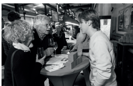
Gäste und Projektteilnehmer tauschten sich aus