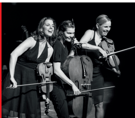
Temperament trifft Können: das Ensemble Salut Salon