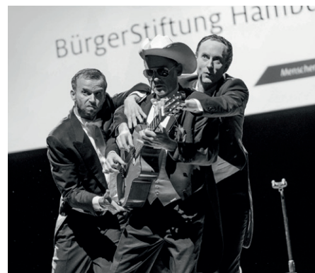
Gitarre sechshändig: Musik-Comedy-Trio Bidla Buh