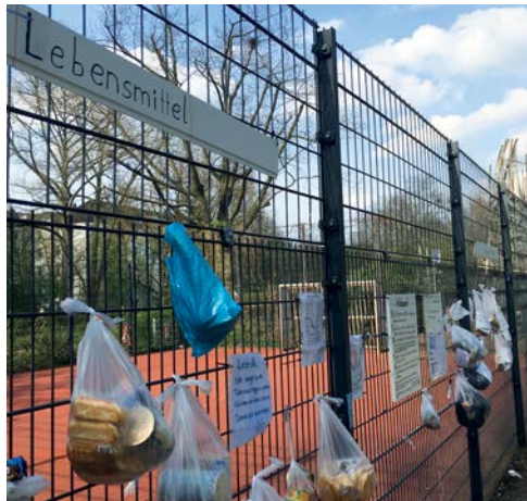
Am Gabenzaun in der Nähe des Isebekkanals können sich Bedürftige mit Lebensmitteln und Hygieneartikeln versorgen (l.) Das derzeit geschlossene Holi Kino nutzt seine Anzeigentafel für eine Botschaft an die Passanten (r.)