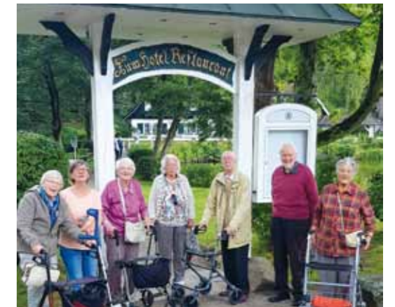
Am Ziel: Die Ausflügler am Forsthaus Seebergen