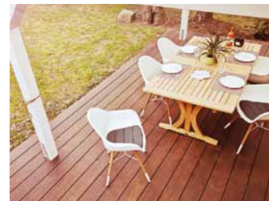
In Eigenbau oder mit dem rundum-sorglos-Paket zur neuen Terrasse.

Wer Holz von seiner schönsten Seite erleben möchte, wird bei HolzLand H. Wulf auf über 12.000 m 2 seine helle Freude haben. ■