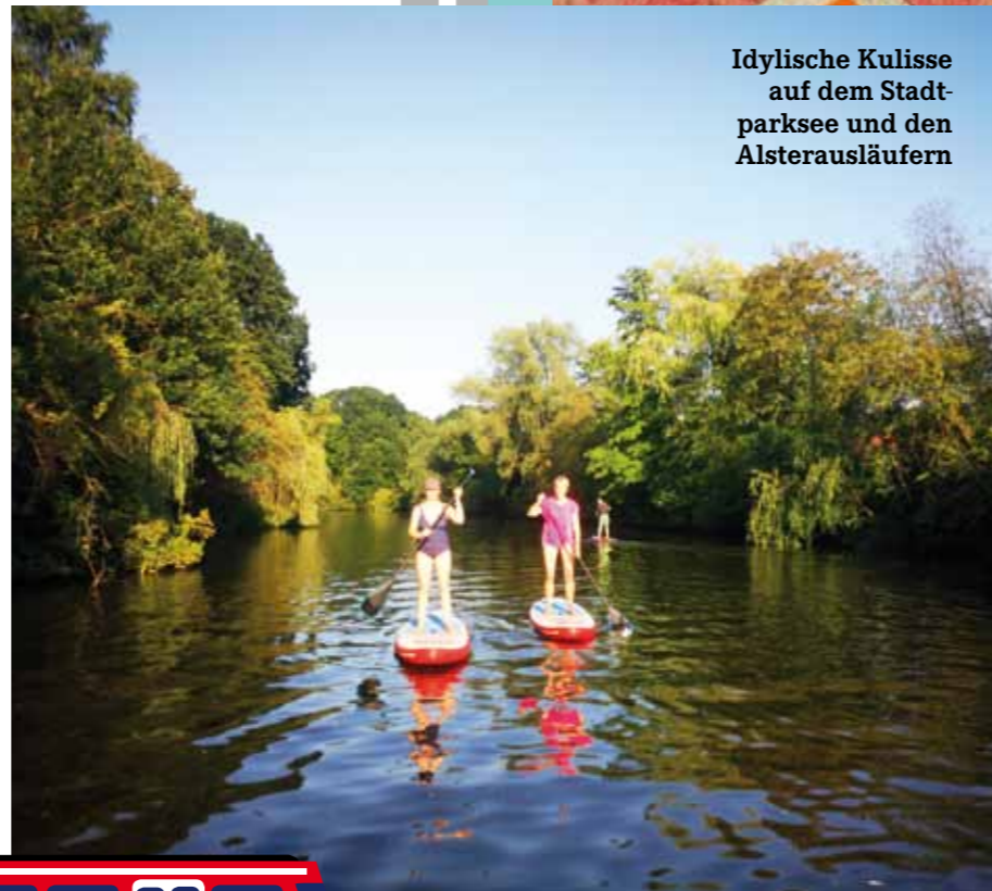
Idyllische Kulisse auf dem Stadtparksee und den Alsterausläufern

Die E-Scooter haben uns fasziniert, denn es fühlt sich cool an, damit zu fahren, aber im Vergleich sind sie teuer und nur für Kurzstrecken geeignet. Die Stadträder sind daher eindeutig die wesentlich sinnvollere Alternative, um im Großstadtverkehr zügig voranzukommen. Und das Stand-Up-Paddling eignet sich hervorragend für den Feierabend, um im Sonnenuntergang zu entschleunigen. ■