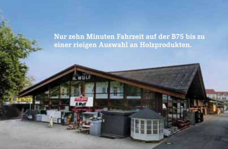
Nur zehn Minuten Fahrzeit auf der B75 bis zu einer riesigen Auswahl an Holzprodukten.