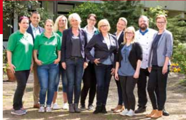
Das sympathische und gut eingespielte Kollegium am Hegen