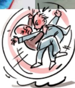
Schlippes Momente Seite 24

22_ Alles Schule Ein TV-Koch rockt die Mensa