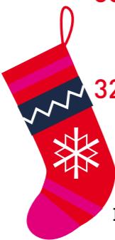
Der Nikolaus kommt. Seite 14

24_ Erziehung ist super! Der Herbst ist da von Jessica Rother