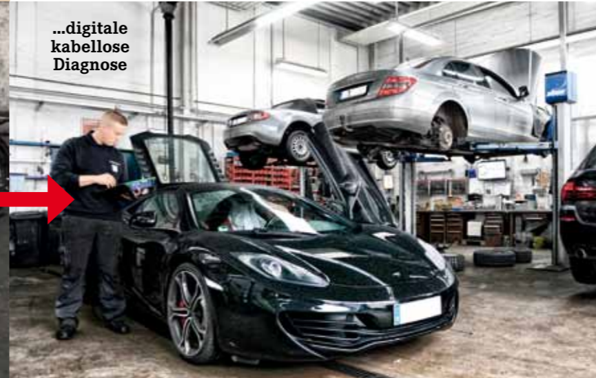
...digitale kabellose Diagnose

Johann Müller GmbH & Co. KG Neuer Höltigbaum 5-7, 22143 Hamburg Tel. 040 / 68 28 79 0 www.mueller-johann.de