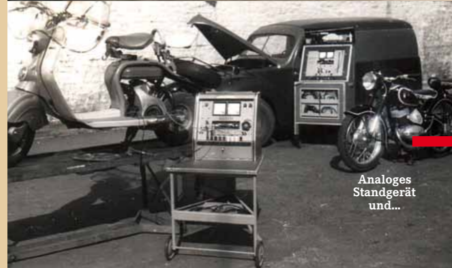
Analoges Standgerät und...