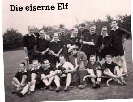
Die eiserne Elf