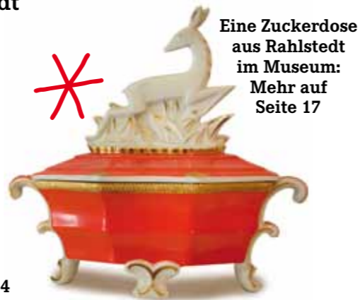
Eine Zuckerdose aus Rahlstedt im Museum: Mehr auf Seite 17