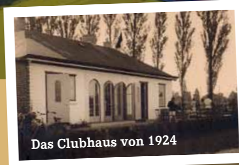
Das Clubhaus von 1924