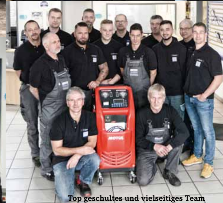
Top geschultes und vielseitiges Team