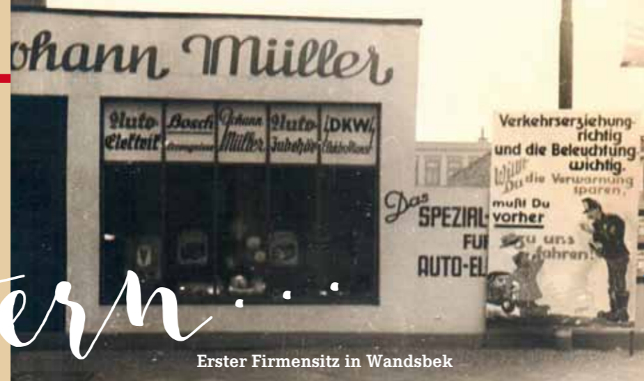
Erster Firmensitz in Wandsbek