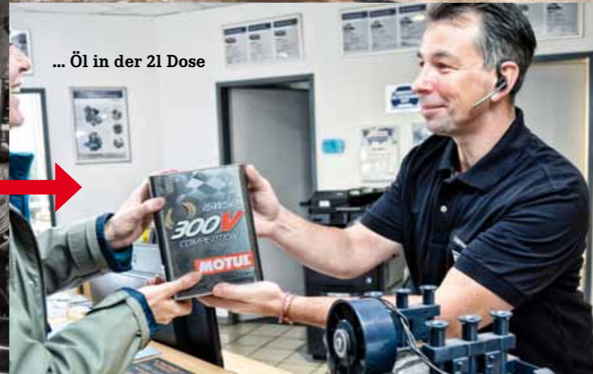
... Öl in der 2l Dose