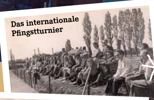
Das internationale Pflingstturnier