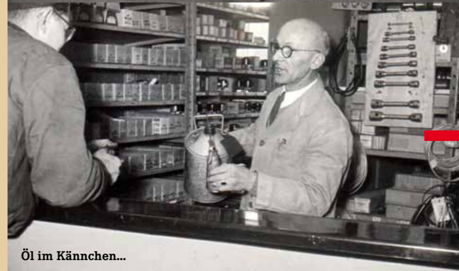
Öl im Kännchen...