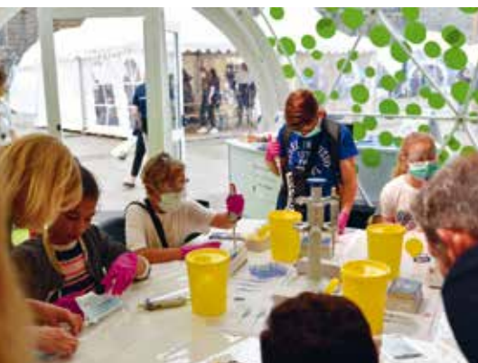
Auch das ist Transfer: Forschende Kinder beim Sommer des Wissens auf dem Rathausmarkt anlässlich 100 Jahre Universität Hamburg

Bei all unseren Projekten, Maßnahmen und Weichenstellungen geht es um nicht weniger als um die Fragen: Wie gelingt es uns, Wissenschaftsfreiheit mit Unternehmergeist zu verbinden? Wie schaffen wir Bedingungen, unter denen Forscherinnen und Forscher Dinge herausfinden, von denen sie noch nicht einmal wussten, dass sie sie suchen? Und wie erreichen wir, dass keine gute Idee aus Hamburg verloren geht, weil ihr Innovationspotenzial nicht erkannt wird?