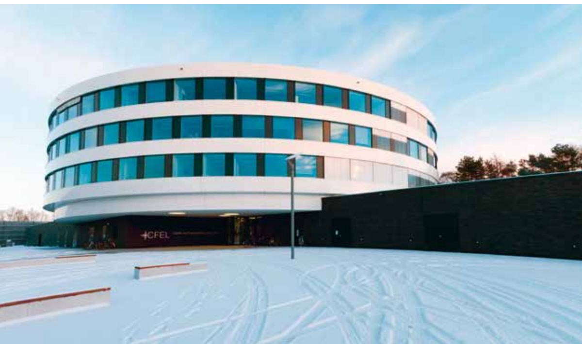
links: Das Center for Free-Electron Laser Science: Der Sitz des MPSD, welches es sich mit seinen Kooperationspartnern DESY und der Universität Hamburg teilt.

Die Wurzeln des Instituts reichen zurück an die Universität Hamburg und die Max-Planck-Forschungsgruppe für strukturelle Dynamik, die dort 2008 entstand. Ihre exzellente Arbeit führte