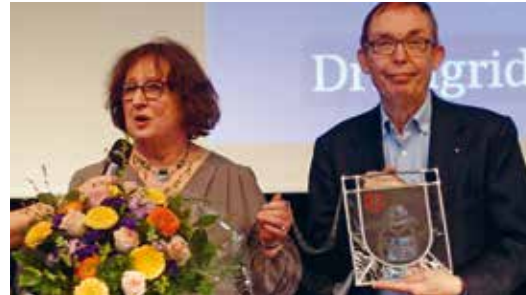
Verleihung des Bürgerpreises der Bezirksversammlung Wandsbek

und im Wettbewerb um den Otto-Linne-Preis 2019 „Wo bist Du, Wandse?“, durch enge Verbindungen zum Verein Freunde des Eichthalparks e. V. und zu weiteren Kooperations- und Netzwerkpartnern, durch Mitwirkung am Aufbau des Teams „Grüner Daumen“ im Eichthalpark genauso wie als Unterstützer weiterer Park- und Stadtteilaktionen. Wenn aktuell das Potenzial des Wandsetals für quartiersnahe Erholung und Begegnung von der Stadtentwicklungs- und Landschaftsplanung entdeckt wird, so kann sie nicht zuletzt auf die praktischen Ergebnisse aus den Bürgerengagements in den Wandsbeker Parkanlagen zurückgreifen.