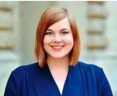
Katharina Fegebank, Zweite Bürgermeisterin und Senatorin für Wissenschaft, Forschung und Gleichstellung der Freien und Hansestadt Hamburg

2019 war ein wahrhaft historisches Jahr für unsere Wissenschaftsstadt: Die Universität Hamburg wurde als Exzellenzuniversität ausgezeichnet, und das im Jahr ihres 100-jährigen Bestehens. Zuvor waren ihr vier Exzellenzcluster bewilligt worden: drei vornehmlich naturwissenschaftliche und ein geisteswissenschaftlicher. Eine bessere Dramaturgie für das Jubiläumsjahr hätten wir uns nicht träumen lassen.