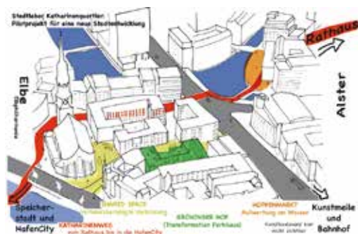
Neue Ideen für ein lebendiges Katharinenquartier