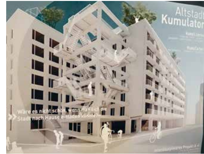
Wohnprojekt statt Parkhaus – Entwurf für den Umbau des Parkhauses Neue Gröninger Straße

„Das Potenzial kirchliche Orte“ ist der Titel eines weiteren Projektes von „Altstadt für Alle!“. Vorgestellt und diskutiert wurde es auf der Ideenwerkstatt „Stadtumbau jetzt!“ im Oktober 2018. Der Grundgedanke: Kirchliche Orte der Innenstadt, das sind neben Kirchen und Kirchplätzen auch soziale Einrichtungen wie z.B. die Rathauspassage, sollen künftig ihr Potenzial für soziale Begegnung, Austausch und Sinnstiftung deutlich stärker entfalten. Lösungsansätze dafür sind die Öffnung kirchlicher Orte für ein neues städtisches Miteinander, wie etwa die Veran-