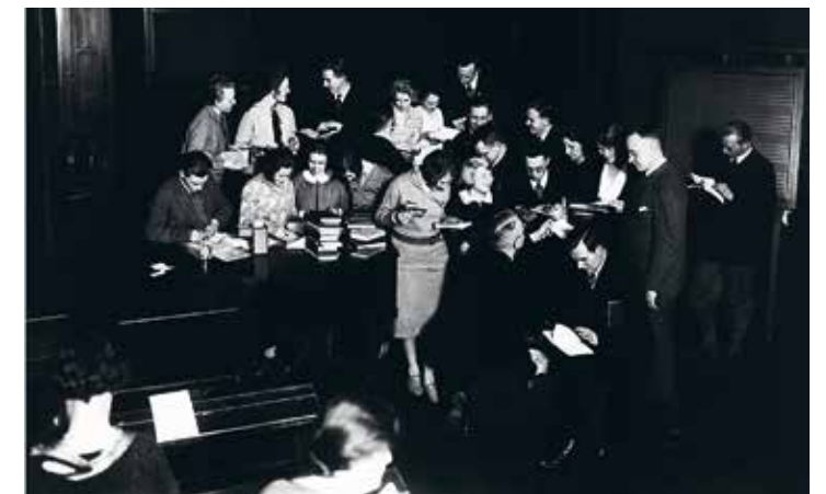
Hamburger Volkshochschule um 1930: Literaturkreis