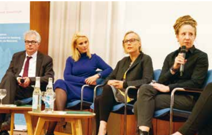
Diskussionsveranstaltung „Stadtumbau jetzt!“

Das Interesse der Zivilgesellschaft an Fragen der Hamburger Verkehrs- und Stadtentwicklungspolitik ist unverändert außergewöhnlich hoch! Diese Erkenntnis drängte sich dem Arbeitskreis (AK) Stadtentwicklung der Patriotischen Gesellschaft erneut bei zwei Veranstaltungen zur Mobilität 2018 und 2019 auf. Im August 2018 wurde gemeinsam mit der Stiftung StadtLandKunst ausgelotet, was Hamburg von anderen Städten lernen kann. Beispiele aus Paris, Düsseldorf und Valencia zeigten die Spannweite innovativer Konzepte. „Man muss Mut zum