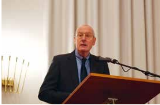
„Humanismus – Freiheit – Individualisierung“ – Vortrag von Prof. Dr. Volker Gerhardt am 30. Oktober 2018, dem Vorabend des Tages der Reformation, im Reimarus-Saal

tums als Folge des Ersten Weltkriegs ließen 1919 das Fehlen einer Universität in Hamburg wirklich als Problem empfinden. Es war nur folgerichtig, dass die demokratische Universitätsgründung Teil einer grundlegenden Reform des Schulsystems war, die den Zugang zum Studium für weniger vermögende Bevölkerungskreise erst möglich machte. Hinzu kam am Ende des Ersten Weltkriegs der Druck einer großen Zahl aus dem Krieg heimkehrender Soldaten ohne abgeschlossene Ausbildung, für die ein Studium in Hamburg bessere berufliche Perspektiven eröffnen konnte. Die demokratische Universitätsgründung vollendete somit die Demokratisierung eines zuvor noch ständischen, teilweise privat organisierten Bildungswesens in Hamburg.