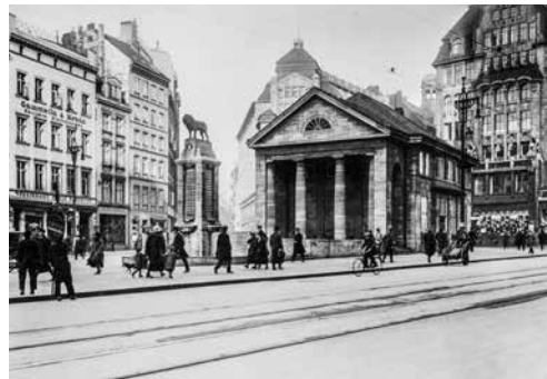
Volkslesehalle in der Mönckebergstraße, erbaut 1914 von Fritz Schumacher

Ausleihstation mit den Bildern der tatsächlich dort stattfindenden vielfältigen Aktivitäten zu überschreiben. Das mag auch damit zusammenhängen, dass die Leistungen dieser Orte jahrzehntelang vor allem auf der Basis der Ausleihzahlen betrachtet wurden. Dann sanken die Ausleihzahlen bekanntermaßen überall. Mit Unbehagen wurden Ausleihrückgänge, die harte Währung in der Diskussion mit kommunalen Geldgebern, konstatiert. Fachintern schärfte man weiter den Bestand, um die mit Sorge betrachteten Ausleihrückgänge aufzuhalten. Der Erfolg war überschaubar. Was allerdings dann passierte und bis heute passiert, ist wunderbar. Die Menschen, die in die Bücherhallen kamen, um möglichst viel an Informationen und Unterhaltung nach Hause zu tragen, kamen weiterhin. Nicht nur das, sie kommen in größerer Zahl und tragen Information und Unterhaltung nicht mehr nur nach Hause, sondern suchen und finden sie vor Ort in den Häusern. Digitale Entwicklungen verstärken den Wunsch nach echter Begegnung und die findet in Bibliotheken statt. Automatisierungsprozesse ermöglichen es dem Personal, die Kommunikation mit den Kund*innen in den Mittelpunkt der Arbeit zu stellen und nicht nur über eine Vernetzung im Stadtteil, sondern mit eigenen Angeboten diese Interaktion zu gestalten. Zusätzliche Öffnungszeiten ohne Personal stellen zumindest den Ort Bibliothek zur Verfügung, der auf diese Weise eine stärkere Sichtbarkeit in der Nachbarschaft erhält.