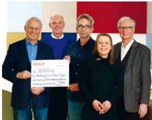
Die Evelyn-Brosch-Stiftung konnte Hamburg Leuchtfeuer mit 10.000 Euro unterstützen.

Die vier treuhänderischen Stiftungen, die von der Patriotischen Gesellschaft verwaltet werden, stellen eine wichtige Ergänzung für die gemeinnützige Arbeit dar. Die Dr. Dorothea-Wilhelm-Stiftung fördert hochbegabte Kinder insbesondere im Rahmen des Diesterweg-Stipendiums Hamburg, die Evelyn-Brosch-Stiftung unterstützt aus ihren Erträgen das Hospiz Hamburg Leuchtfeuer. Die Erträge der Ilse-Lübbers-Stiftung , deren Mittel ebenfalls aus einer Erbschaft stammen, werden von der Patriotischen Gesellschaft für Zwecke des Denkmalschutzes eingesetzt. Zweck der Golden Pudel Stiftung ist die Förderung von Kunst und Kultur. Sie soll den Erhalt des Golden Pudel Clubs dauerhaft sichern. Insgesamt verfügen die vier unselbständigen Stiftungen über ein Stiftungskapital von rund 2,5 Millionen Euro. Die Verwaltung der Stiftungen übernimmt die Geschäftsstelle der Patriotischen Gesellschaft, die Förderentscheidungen treffen die Kuratorien.