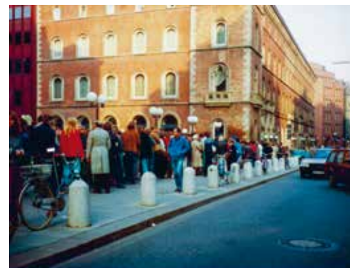
Menschen stehen 1983 zur Kursanmeldung Schlange.