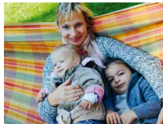
Aus dem Leitbild der Elbkinder: „Kinder stehen im Mittelpunkt unserer Arbeit. Wir fördern sie vielfältig und geben ihnen Geborgenheit. Wir respektieren die uns anvertrauten Kinder in ihren Rechten und ihrer Würde. Wir nehmen sie mit ihrer einzigartigen Persönlichkeit an. Unsere Kitas sollen für die Kinder ein Ort der Geborgenheit sein, in dem sie sich zuhause fühlen.“

Die Bildungsdebatte im Kita-Bereich hat nicht dazu geführt, dass die Institution Kita von der Verantwortung für die Vereinbarkeit von Familie und Beruf entlastet worden wären. Ganz im Gegenteil waren die 2000er Jahre die Zeit, in der sich vermehrt auch die Wirtschaft mit dem Thema auseinandersetzte. Hohe Arbeitslosenzahlen bei fachlich gut qualifizierten Personen gab es nicht mehr, Arbeitgeber konkurrierten um gute Mitarbeitende. Wirtschaftsverbände forderten öffentlich eine Ausweitung der Betreuungszeiten, manche Arbeitgeber schufen eigene Kinderbetreuungsmöglichkeiten, andere kooperierten mit vorhandenen Einrichtungen. Flankierend sorgte der Staat nun für eine im internationalen Vergleich großzügige Gesetzgebung, die es Eltern erlaubt, sich nach der Geburt des Kindes ein Jahr selbst um dieses kümmern zu können, mit einer finanziellen Unterstützung angelehnt an das vorherige Gehalt. Ab dem vollendeten ersten Lebensjahr gibt es dann zusätzlich einen Rechtsanspruch auf Kinderbetreuung, der von