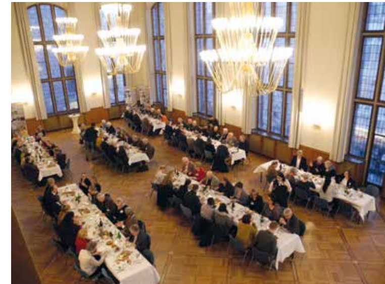
Abendbrot für Mitglieder der Patriotischen Gesellschaft

Überlegungen und Konzeption der Kommunikationsstrategie waren die vielen, thematisch sehr breit gestreuten Veranstaltungen und das geringe Budget für Kommunikation. Aktuell erhalten die rund 400 Mitglieder der Patriotischen Gesellschaft alle Einladungen per E-Mail oder Post, per E-Mail gehen personalisierte Einladungen an alle Adressen im Verteiler „Veranstaltungen“. Da auf Grund der neuen Datenschutzverordnung nur Adressen mit