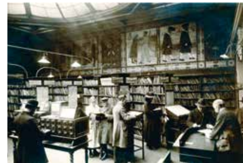
Freihandbereich in der Bücherhalle Kohlhöfen

auch aus dem eigenen Budget aufzubringende Investitionen für den Abbau und die Rückgabe der aufgegebenen Mietflächen in Millionenhöhe, die sich erst später auszahlten. Ohne eine einzige betriebsbedingte Kündigung wurden in diesem Zeitraum weit über 200 Vollzeitstellen abgebaut, noch mehr Kolleg*innen hatten sich meist zunächst ungewollt an ein anderes Kollegium zu gewöhnen. Dennoch konnten die Leistungen, gemessen in Kennzahlen, durch höhere Nachfrage und den Einsatz von Technik über Jahre hinweg stetig gesteigert werden.