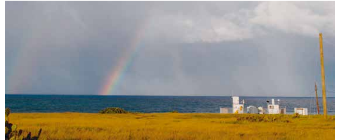
Messstation zur Erforschung der Wechselwirkung zwischen Wolken, Niederschlag und atmosphärischer Zirkulation in den Tropen. Diese Messstation auf Barbados ist die weltweit einzige ihrer Art.