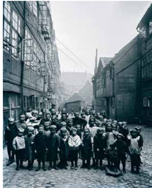
Kinder im Gängeviertel am Hamburger Hafen um 1901. Wenn ihre Eltern arbeiteten, waren viele Kinder sich selbst überlassen. Kinderbewahranstalten oder „Warteschulen“ sorgten in Hamburg ab den 1830er Jahren für Verpflegung und Betreuung, zumeist jedoch fern moderner Standards.

Jahre für Kinder. Nach einem Anstoß durch die Hamburger Ortsgruppe des Allgemeinen Deutschen Frauenvereins im Sommer 1911 hatte sich in den Folgejahren unter der Federführung der Hamburgischen Gesellschaft für Wohltätigkeit ein Netzwerk zur Reformierung des Warteschulwesens formiert, dessen private und behördliche Mitstreiter als „Ausschuß für Säuglings- und Kleinkinderanstalten“ ans Werk gingen und diesen schließlich am 24. Februar 1919 in das Vereinsregister eintragen ließen: Die spätere Vereinigung Hamburger Kitas und heutige Elbkinder gGmbH ist ein Unternehmen der Freien und Hansestadt Hamburg. Mit rund 31.000 täglich betreuten Kindern sind die Elbkinder der größte Kita-Träger Hamburgs und mit fast 7.000 Mitarbeitenden auch einer der größten Arbeitgeber der Stadt.