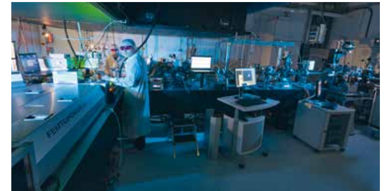
Ein MPSD-Laserlabor im Center for Free-Electron Laser Science

2014 gelang es Cavalleris Team in Kooperation mit anderen Gruppen jedoch, Supraleitung kurzfristig bei Raumtemperatur zu generieren – ein wahrer Forschungsdurchbruch, möglich gemacht durch gezielte Laserbestrahlung.