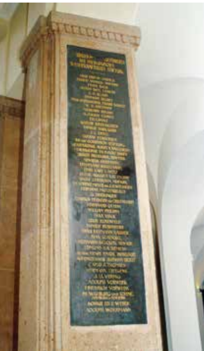
Die Marmortafel im Hauptgebäude der Universität Hamburg

B is zur Gründung der Hamburgischen Universität 1919 ermöglichte die Hamburgische Wissenschaftliche Stiftung durch die Übernahme oder Aufstockung von Honoraren zahlreiche Berufungen hervorragender Wissenschaftler nach Hamburg – darunter befanden sich so bekannte Namen wie der des Psychologen William Stern, des Erfinders des Intelligenzquotienten. Auf diese Weise festigte sie den Ruf Hamburgs als Wissenschaftsstandort.