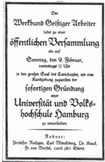
Gründungsaufruf der Hamburger Volkshochschule

Volkshochschule. Adams befragte die Hörerinnen und Hörer. Sein Fazit: die Teilnehmer strebten vor allem nach einer „tieferen politischen Bildung“. Adams baute das Angebot aus und die Teilnehmerzahl stieg um 43 Prozent.