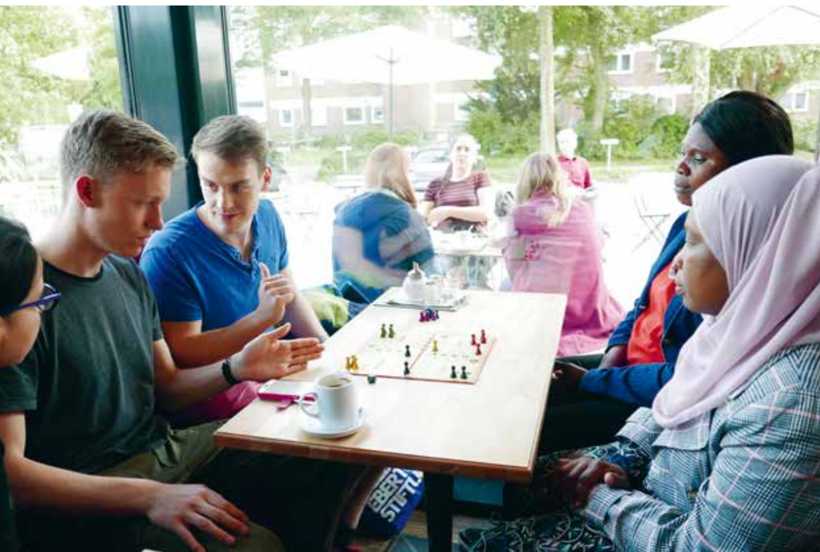
Plauderrunde im Aufbauunterricht des Diesterweg-Stipendiums