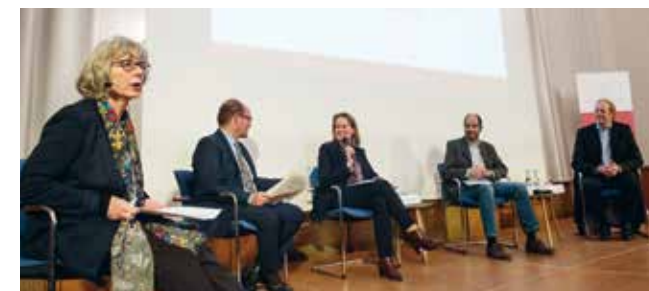
Mobilitätskonzepte der Zukunft – Wie nachhaltig bewegt sich Hamburg 2030?