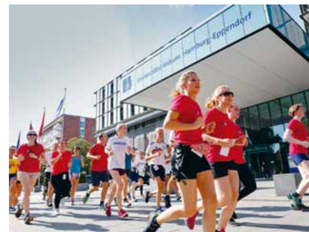
Laufend spenden: Der Benefizlauf zugunsten der Kinder- und Jugendpsychiatrie des UKE

Dieses selbstverständliche Miteinander von Wissenschaft, Gesellschaft und Wirtschaft entspricht meiner Vision von Hamburg als Wissenschafts- und Innovationsmetropole. Es verbindet Wissenschaftsfreiheit mit dem Anspruch, in die Gesellschaft hineinzuwirken und Lösungen