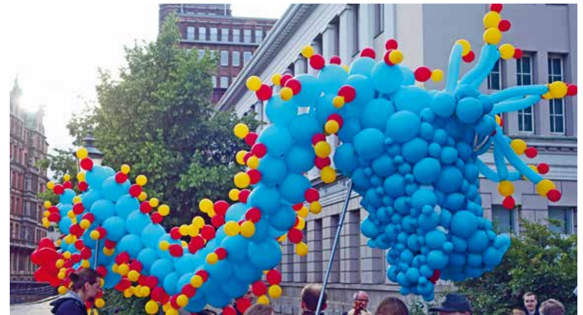
Ballondrache auf Altstadttour beim Alten Stadthafen

Ein weiterer wesentlicher Baustein ist die vielfältige Unterstützung und ehrenamtliche Mitarbeit von Expert*innen u.a. aus Wissenschaft,