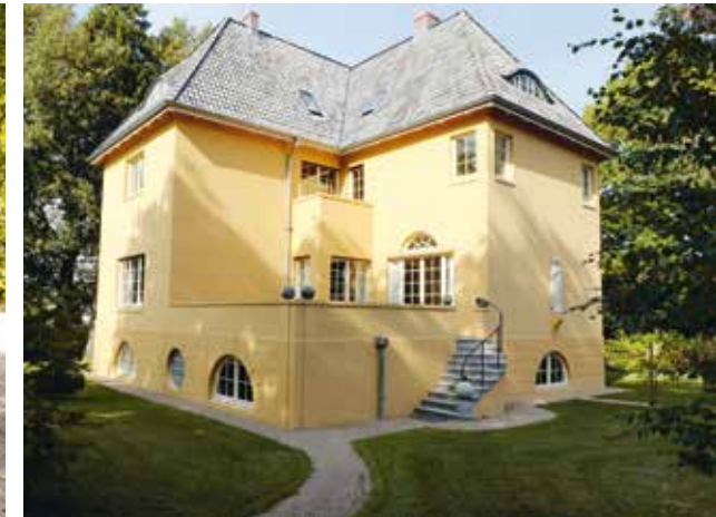
Preis für Denkmalpflege 2018 – die Preisträgerobjekte, ausgezeichnet mit der Plakette der Patriotischen Gesellschaft: die Arp Schnitger-Orgel in St. Pankratius, die Kunstkate Volksdorf sowie das Richard-Dehmel-Haus

der Denkmal-Eigentümer. Ein besonderes Augenmerk haben wir auf die Ablesbarkeit der Zeitgeschichten gelegt, die das Gebäude durchlebt hat. Kein Gebäude ist heute noch im Originalzustand völlig erhalten. Deshalb sind die „Jahresringe“, die es „erlebt“ hat, als wertvolles Zeitzeugnis auch für nachfolgende Generationen zu werten.