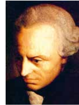
Immanuel Kant: „Das: Ich denke, muß alle meine Vorstellungen begleiten können“.